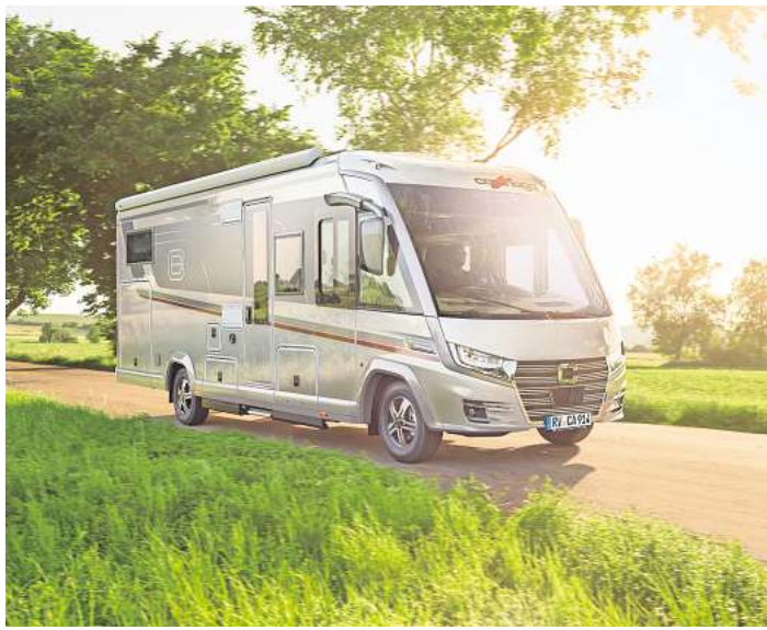
Bietet viel Komfort: Der Carthago e-line von Fiat.

Hannover Camper Wilhelm-Röntgen-Straße 4 30966 Hemmingen www.hannover-camper.de