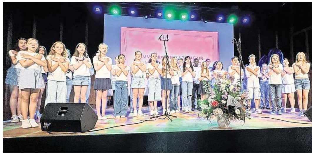
Darbietungen: Auch Tanz und Gesang gehörte zu den Programmpunkten beim Festakt.

gin zarte 29 Jahre alt, nun sprach sie als 89-Jährige zum Publikum. „Früher war bei uns noch alles ganz anders in der Schule. Ich habe mitbekommen, welche Hindernisse das Gymnasium überwinden musste hinsichtlich des Neubaus und der Probleme im Altbau. Ich bin stolz, dass ich hier dabei sein darf.“ Mehrtens unterrichtete früher Erdkunde und Sport. Zwischendurch, erzählte sie, lebte sie für eine lange Zeit in Magdeburg, weil ihr Mann Bundesbeamter ist. „Nun bin ich aber wieder in Hannover und verfolge die Geschicke meiner alten Schule aus nächster Nähe. Hier hätte ich auch noch gern Unterricht gegeben.“