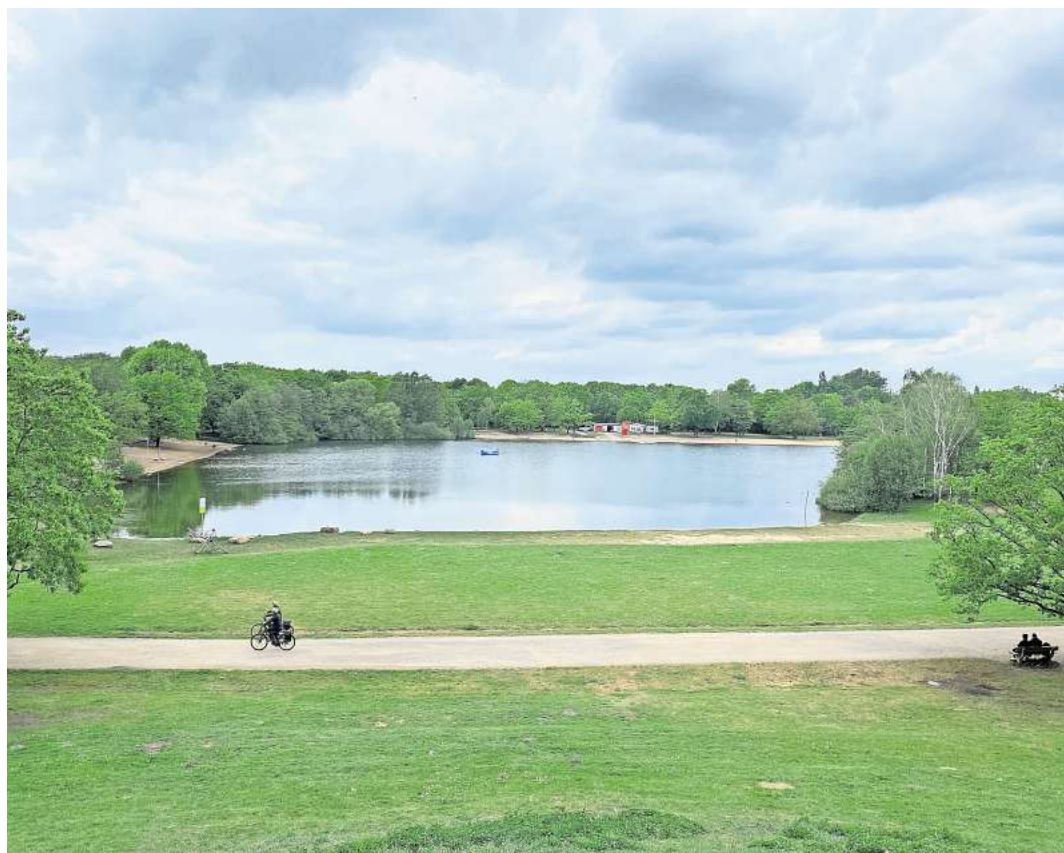
Erster Tag des Grillverbots: Wegen des unbeständigen Wetters ist rund um den Silbersee kaum was los.

Finanzen: Die 21 Kommunen zahlen einen Anteil ihrer Steuerkraft an die Region, was laut Borschel 2026 bei rund 42 Prozent lag. Im Gegenzug erhalten sie die beschriebenen zentralen Leistungen wie beispielsweise Rettungsdienst, ÖPNV, Berufsschulen oder Sozialhilfe. „Trotz finanzieller Herausforderungen wurde die Umlage in den letzten Jahren nicht erhöht, um die Kommunen zu entlasten“,