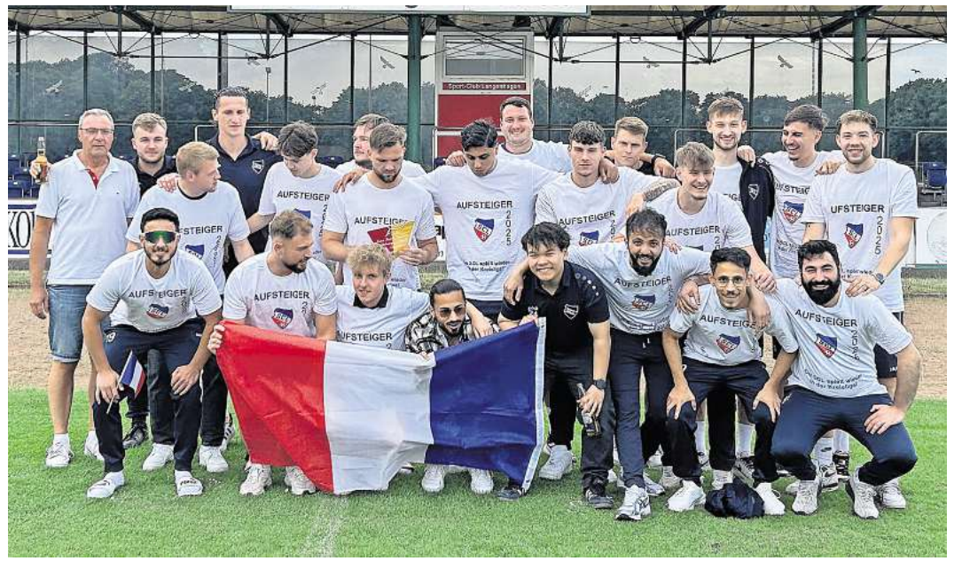
Die erste Herren des SC Langenhagen nach dem Aufstieg in die Kreisliga am Ende der Saison 2024/2025.

Nach einigen Spielerabgängen am Saisonende ist nun ein Neustart für die nächste Saison nötig. Es ist ein Umbruch in der Kreisliga, gegebenenfalls auch in der ersten Kreisklasse mit neuen Spielern und neuem Trainerstab geplant. Perspektivisch wird von Vereinsseite Fußball im „Bezirk“ angestrebt. Gesucht werden ausgebildete Spieler für alle Mannschaftsteile. Es sollen sich alle Fußballer angesprochen fühlen, die an diesem Projekt des traditionsreichen SCL mitmachen möchten. Willkommen ist jeder, der Spaß am Fußballspielen hat und dabei Wert auf Gemeinschaft und Teamgeist legt. Der Verein bietet außergewöhnlich gute äußere Bedingungen mit vier Rasenplätzen, zusätzlichen Trainingsflächen, eigener Sporthalle und einem Clubheim. Gesucht werden also sowohl ein neuer Trainerstab als auch erfahrene, ältere Spieler, vielleicht auch Wiedereinsteiger; genauso aber auch A-Jugendspieler, die erstmalig in den Herrenbereich wechseln und weiterhin Spaß am