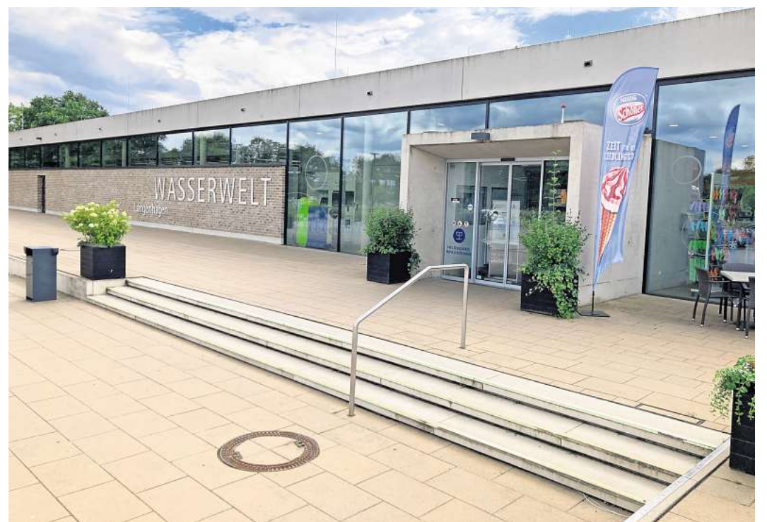
Keine Warteschlange am Eingang: Die Wasserwelt öffnet erst wieder am 24. Juni.

Anders bewertet der Betriebsausschuss des Bades einen Vorschlag des Seniorenbeirats. Der hatte einen vergünstigten Eintrittspreis von 6,10 Euro für Se-