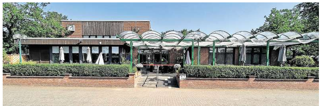
Die Rahmenbedingungen beim SC Langenhagen an der Leibnizstraße stimmen.