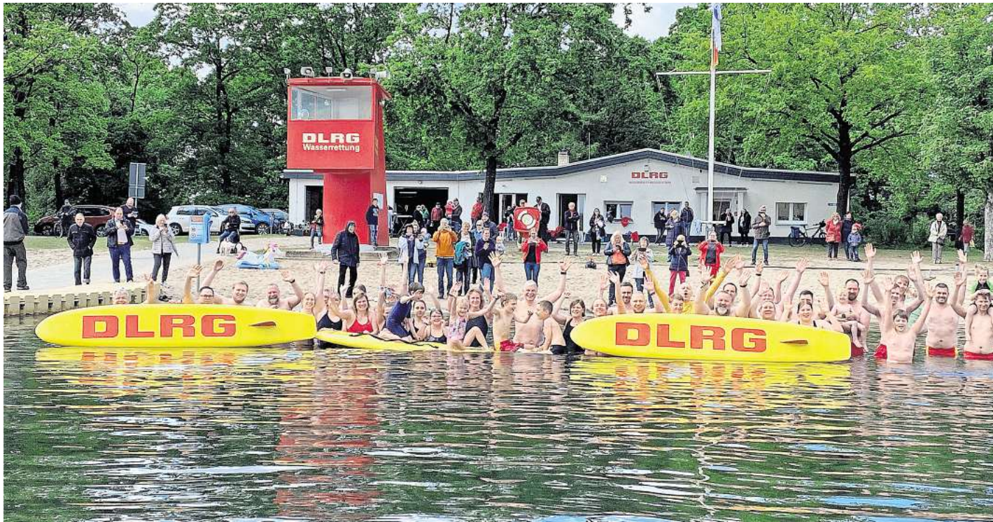
Auftakt: DLRG-Mitglieder starten im Silbersee mit der Wachsaison.

Die Stadt Langenhagen hatte am 9. Mai ein Grillverbot am Silbersee verhängt. Mittlerweile hat die Stadtverwaltung auch große Banner angebracht, die auf das Verbot hinweisen. Der große Parkplatz östlich des Sees ist nach wie vor mit Betonringen versperrt. Am ersten Wochenende, an dem das Grillverbot galt, hatte das städtische Ordnungsamt verschärft kontrolliert. Dichte Rauchschwaden wie etwa am 1. Mai blieben aus. Lediglich picknickende Gruppen hielten sich dort auf - und nahmen ihren Müll wieder mit. Am Freitag, 15. Mai, wachten zeitweise Polizisten mit Argusaugen darüber, dass niemand gegen die Regeln verstieß. Abzuwarten bleibt nun, wie sich die Situation entwickelt, wenn die Temperaturen anziehen und mehr Menschen den Silbersee ansteuern. Pfingsten könnte dabei zur ersten Nagelprobe werden - dann sollen die Temperaturen über die 25-Grad-Marke steigen.