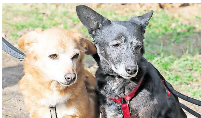
Pixi und Tonka.

und zeigt was sie will. Sie ist selbstbewußter als die schwarze Tonka. Die ist zurückhaltend und versteckt sich oft unter dem Tisch. Sie hat eine nette bescheidene Art. Pixi ist ihr Halt. Sie lernt von Pixi und orientiert sich an ihr. Sie zeigt sich am Anfang etwas zurückhaltend, springt dann aber gleich in die Arme und gibt Küsschen. Die zauberhaften kleinen Hündinnen sind jedem gegenüber freundlich und lieb. Sie sind jede auf ihre eigne Art sehr anhänglich - lieben die Gemütlichkeit und das Sofa. Es macht Freude, sie um sich zu haben, denn gemeinsam sind sie unternehmungslustig und neugierig. Pixi geht gut an der Leine und ver-