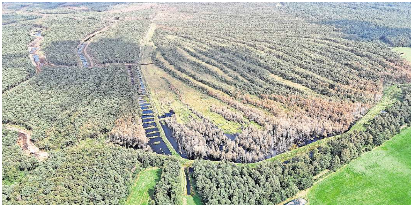
Das Otternhagener Moor im August 2025. Die Maßnahmen und Erfolge der Wiedervernässung sind durch die gebauten Verwallungen und den leicht überstauten Flächen zu erkennen.

Besonders hervorzuheben ist der Abschluss der Arbeiten im Otternhagener Moor. Nach intensiven Bauarbeiten und notwendigen Optimierungen infolge des Winterhochwassers 2023/24 kann sich das Gebiet nun wieder eigenständig als Hochmoor entwickeln. Somit sind die geplanten Maßnahmen in zwei der vier Hochmoore – im Schwarzen Moor bei Resse und im Otternhagener Moor – erfolgreich abgeschlossen. Die zahlreich angelegten Grabenverschlüsse und Moordämme entfalten ihre Wirkung in der Fläche. „Nach langen und intensiven Arbeiten im Na-