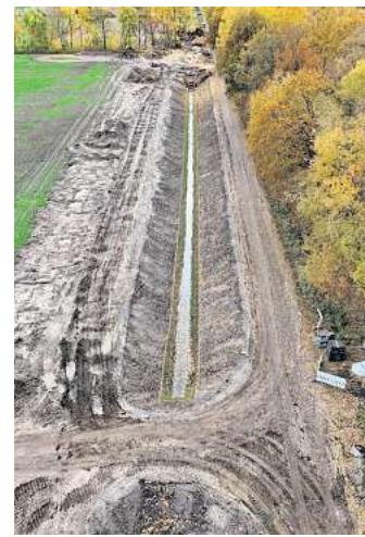
Umbau des Entwässerungssystems Kaltenweider Hauptvorfluter außerhalb der Moorflächen für die angrenzenden Nutzflächen am Achtminutenweg in Langenhagen.

storfer Mooreine Vielzahl an Vorhaben um, um den Regenwasserabfluss nachhaltig zu stoppen. Dabei kam ein bewährtes Verfahren zum Einsatz: Entlang geplanter Damstrassen wurde zunächst die Vegetation entfernt, anschließend wurden mit dem vor Ort vorhandenen Material – überwiegend Torf – Verwallungen errichtet. Diese dienen dazu, den Wasserabfluss zu reduzieren und die natürliche Wasserspeicherung der Moore wiederherzustellen. Eine der größten Einzelmaßnahmen war die Umgestaltung des rund 2,5 Meter tiefen und rund 2.500 Meter