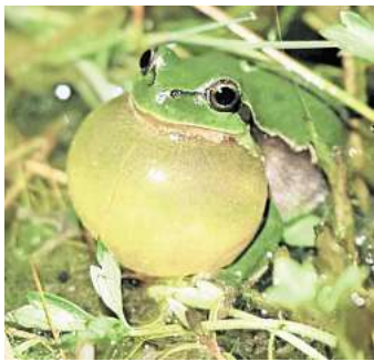
Ein Laubfrosch in voller Pracht.

Neben dem Laubfrosch kommen natürlich noch andere Amphibien im Gebiet vor, die der NABU den Teilnehmern ebenfalls im Rahmen der Wanderung vorstellen möchten. Der Höhepunkt der Veranstaltung am 2. Mai ab 21 Uhr wird dann ab ca. 22.30 Uhr das Konzert der Laubfrösche sein. Bei dieser Abendwanderung kann man den Erfolg von