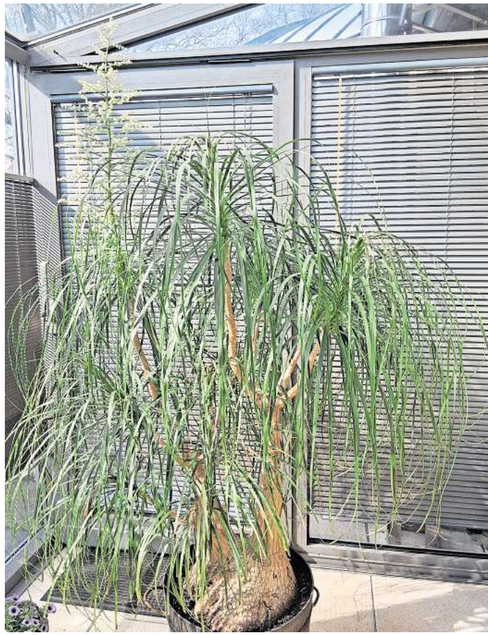
Ist bei Familie Pelz in Langenhagen zu finden: Elefantenfuß.