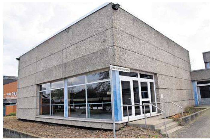
Die Vergangenheit: Die kleine Sporthalle an der IGS Langenhagen wird bald abgerissen.

Und derzeit ist der bauliche Zustand der IGS schwierig, wie es der Architekt formulierte. Des-