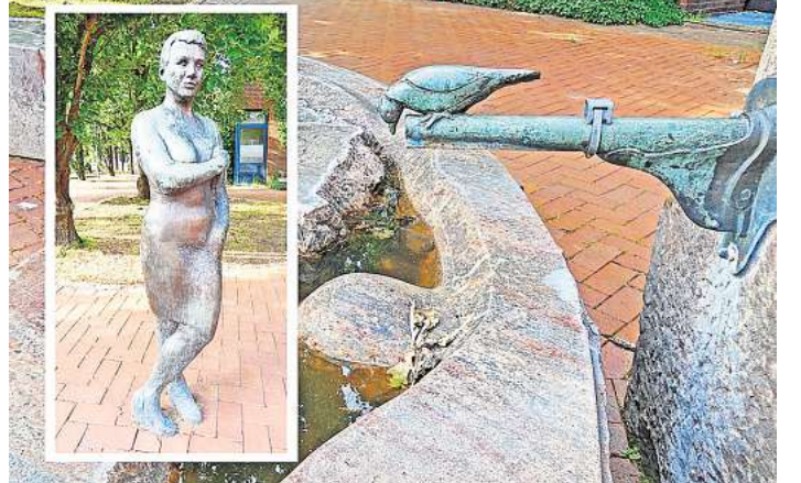
Beliebte Fotoobjekte auf dem Rathausplatz.