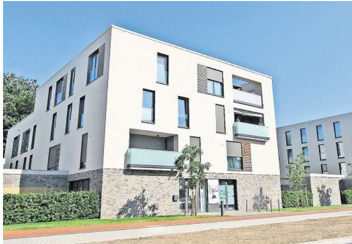
Neuer Wohnraum entstand nach 2010 an der Walsroder Straße.

LANGENHAGEN (BE). In der letzten Ausgabe haben wir uns den Themen Bildung und Demographie anhand von Zensuszahlen gewidmet. Heute geht es um das Wohnen in der Stadt. Im Zensus 2011 ergab sich für Langenhagen, dass die Bevölkerung über weniger Wohnfläche verfügt als der deutsche Durchschnitt. Die Größe der vorhandenen Wohnungen ist beim Zensus 2022 gestiegen. Mit 87,5 Quadratmetern lagen Langenhagener Wohnungen 2011 fast exakt im Regionsdurchschnitt. Mittlerweile ist die durchschnittliche Langenhagener Wohnung 90,8 Quadratmeter groß und verfügt über 4,1 Zimmer. Eine positive Entwicklung – doch die zieht sich durch jede Betrachtungsebene. Die Niedersachsen wohnen 2011 in Wohnungen mit durchschnittlich genau 100 Quadratmetern – nun sind es 104,4. Langenhagen bleibt unter dem deutschen Mittelwert von 94,4 Quadratmetern. Der schnelle Exkurs zum glücklichen Speckgürtel sei erlaubt. Wedemärker wohnen in 118,5, Isernhagener in 118,4 Quadratmeter großen Wohnungen. Ein tröstlicher Blick in die Landeshauptstadt: Durchschnittlich 78,1 Quadratmeter groß sind die Wohnungen hier nur.