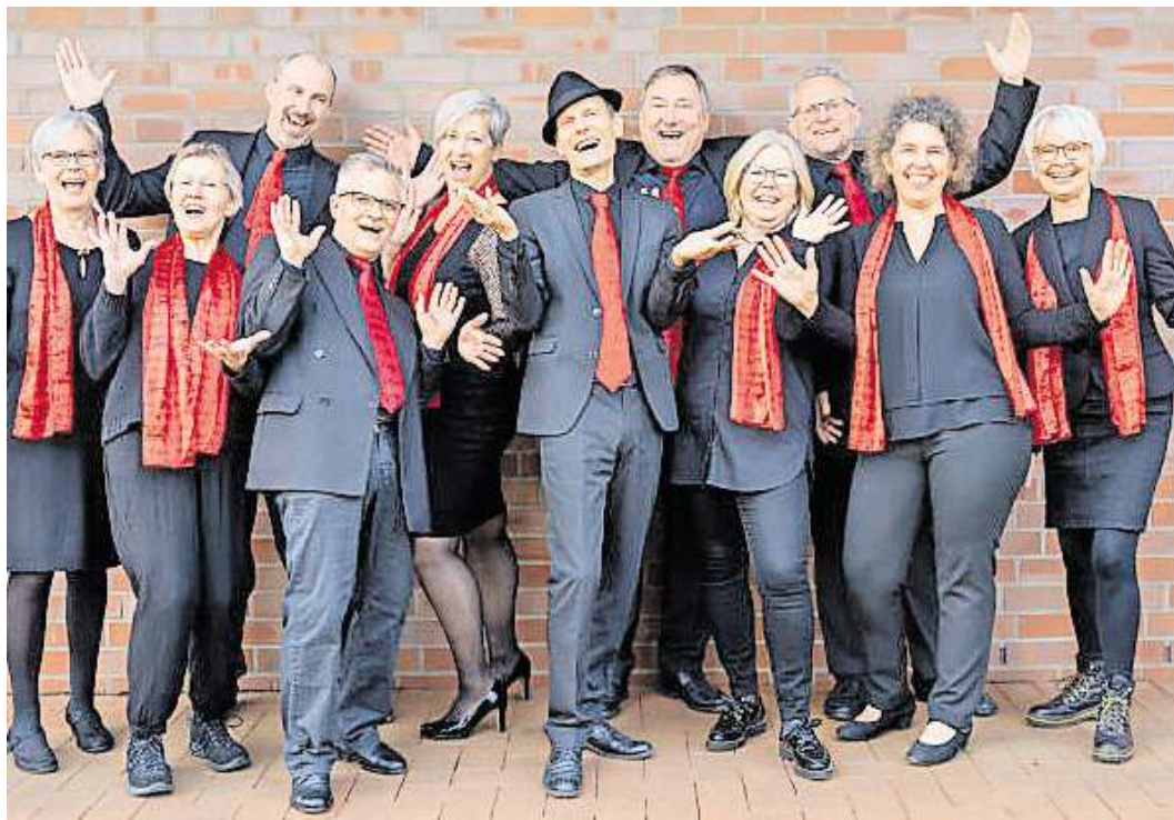
Das Lindwedeler Ensemble gastiert in Langenhagen.

Der musikalische Bogen spannt sich von den späten 1960er Jahren bis in die 2010er Jahre und bietet damit sowohl für jüngere Zuhörerinnen und Zuhörer als auch für Junggebliebene viele vertraute Melodien. Thematisch bewegt sich das Programm zwischen Erinnerungen an Vergangenes und Ausblicken auf Zukünftiges, zwischen Liebesfreud und Liebesleid. Musikalisch geht es dabei auf eine