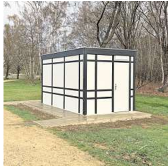
Ergänzung des Toilettenangebotes am Ostufer.

Die moderne Toilettenanlage an den Grillflächen arbeitet vollständig autark und kommt ohne