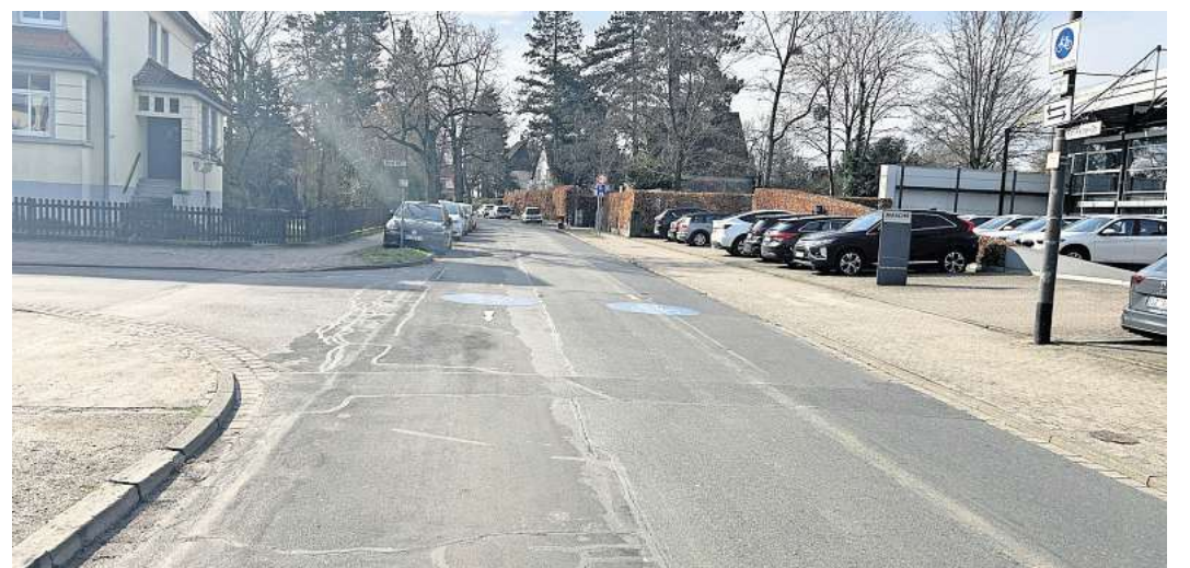
An der Karl-Kellner-Straße wird wieder gebaut.

Im zweiten Abschnitt werden der östliche Gehweg (ungerade Hausnummern) und die Fahrrad im Bereich vom Bahnhofsplatz bis ca. Höhe Hausnummer 81 hergestellt, die Fahrbahn zunächst ohne abschließende Asphalt-Deckschicht. Punktuell werden dabei vorweg Schadstellen an Regenwasser- und Schmutzwasserkanal repariert. Der dritte Abschnitt erfolgt analog zum zweiten Abschnitt: von ca. Hausnummer 81 bis zur Ein-