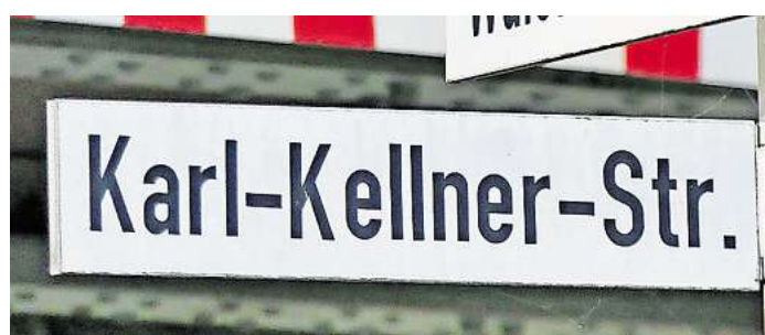
Einem couragierten Mann gewidmet.