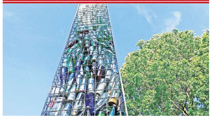
Hoch ragt der Obelisk an der Konrad-Adenauer-Straße auf.