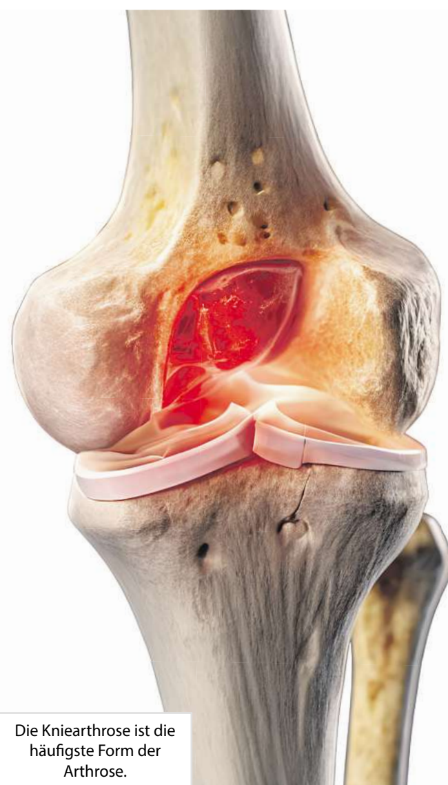
Die Kniearthrose ist die häufigste Form der Arthrose.

„Seit Tagen habe ich keine Schmerzen mehr im Knie. Auch nachts nicht. Ich werde die Tropfen weiter nehmen!“ (Klaus W.)