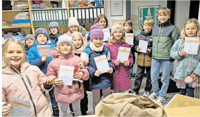
Ein Teil der ausgezeichneten Kinder.

Sportplatz Bissendorf immer donnerstags ab 18 Uhr nach vorheriger Absprache (Infos auf der Homepage). Die Anforderungen für das Sportabzeichen sind im steten Wandel und bestehen schon lange nicht mehr aus rein leichtathletischen Disziplinen und Schwimmen. Neben der obligatorischen Schwimmfähigkeit geht es vielmehr um die allgemeinen Bereiche Ausdauer, Schnelligkeit, Kraft und Koordination, die für ein gesundes Leben wichtig sind. So gibt es zum Beispiel seit 2024 den erweiterten Leistungskatalog Kraft mit Übungen wie Liegestütze, Klimmzüge, Crunches oder Triceps-Dips. Auch im Bereich Koordination wird es neue Übungen wie Ball