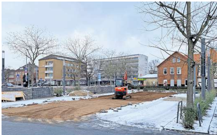
Abgesackt: Die Parkplätze am Einkaufszentrum Elisabetharkaden müssen erneuert werden, weil der Untergrund nicht stabil ist.