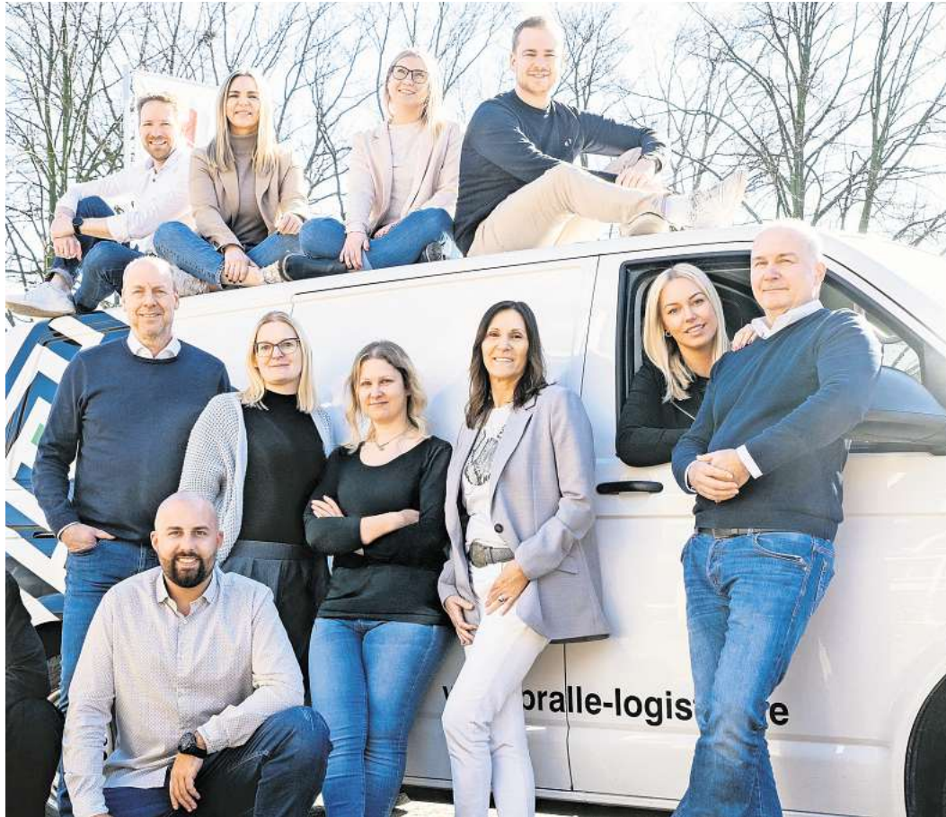
Das kaufmännische Team.

Mit 100 eigenen Fahrer*innen, 25 kaufmännischen Mitarbeitenden, einer modernen Fahrzeugflotte, einem großen Netzwerk bestehend aus 250 Partnern, dem Stammhaus in Langenhagen und 16 Dienstleistungsstandorten von Hamburg bis München koordiniert Pralle täglich zahlreiche Transpor-