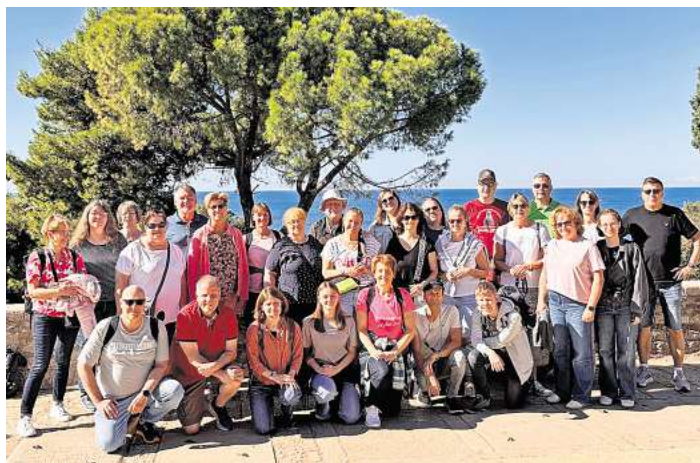
Langenhagener Musiker in Kroatien auf Tour.

Auch Rovinj und Pore standen auf dem Reiseplan. In Rovinj führte eine sachkundige Stadtführung durch die malerischen Gassen der Altstadt und vermittelte spannende Einblicke in Geschichte und Lebensart Istriens. Inmitten der Weinberge durfte eine Weinverkostung natürlich nicht fehlen – begleitet von einem stimmungsvollen Abendessen in einer traditionellen Kloba.