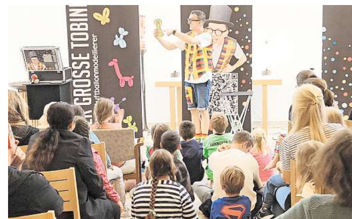
Die Kinder und Erwachsenen erfreuten sich an dem bunten Programm.

Den Auftakt machte ein Familiengottesdienst zur Geschichte von Jona und dem Wal. An-