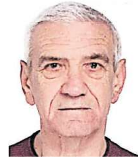
Wer kennt den Mann? beim Kriminaldauerdienst Hannover unter der Telefonnummer (0511) 109-55 55 zu melden.

Die Polizei bittet Zeuginnen und Zeugen, die in der Nacht von Sonnabend, 23. August, auf Sonntag, 24. August, oder am frühen Sonntagmorgen Verdächtiges im Bereich des Silbersees beobachtet haben, sich