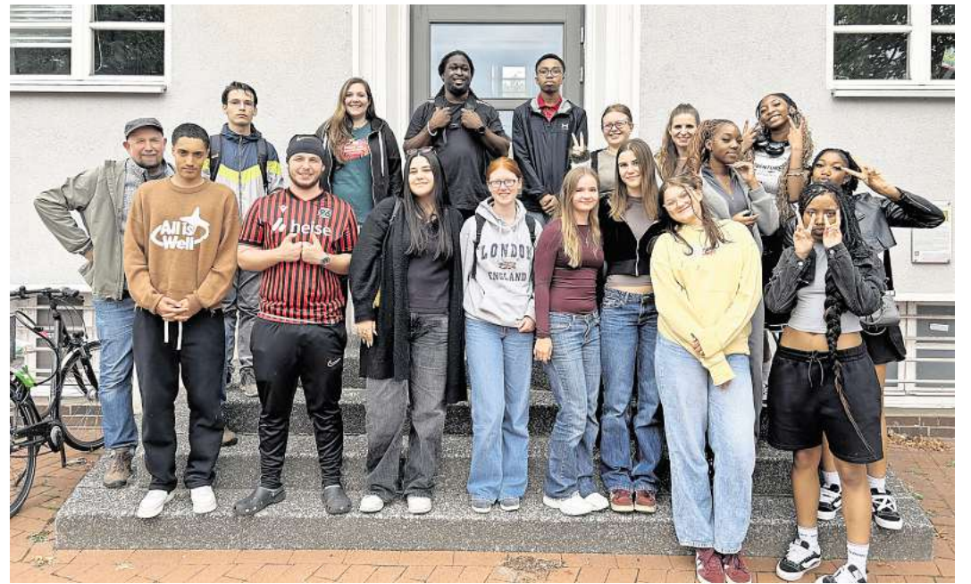
Treffen in Londonhagen.