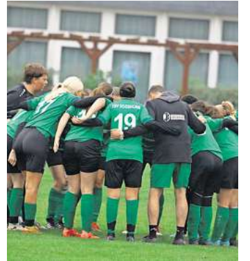
Der Spaß kommt am Sonntag, 31. August, auf der Godshorner Sportanlage garantiert nicht zu kurz.

Fußballkenntnisse sind nicht erforderlich – willkommen sind alle, die Lust haben, den Sport