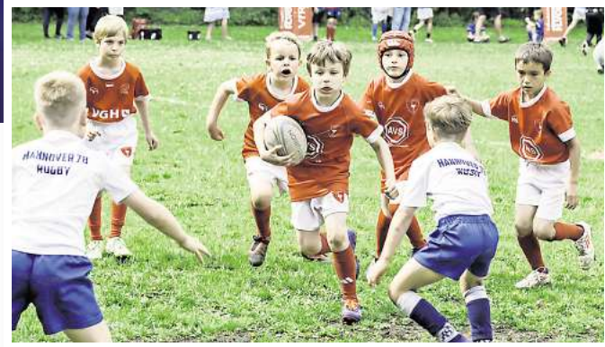
Die VfR-Jugend in Aktion.