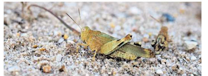
Die Blauflügelige Ödlandschrecke.