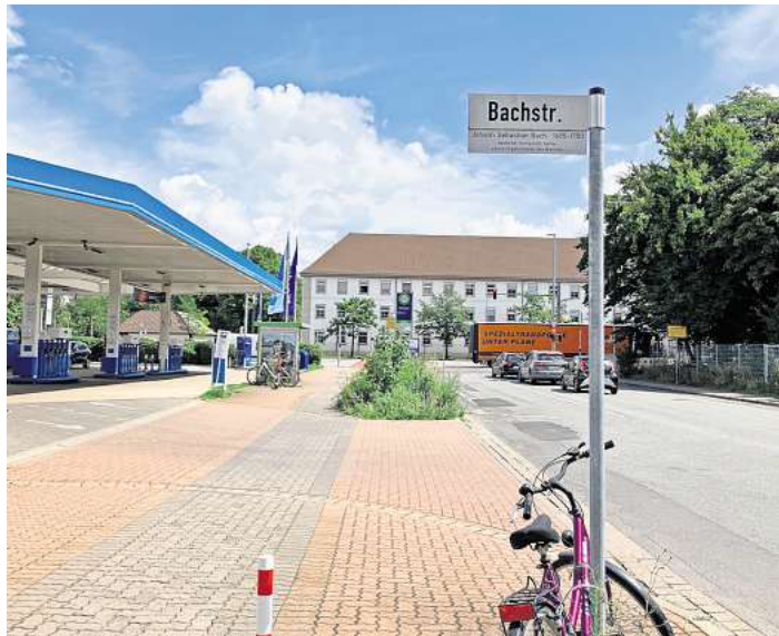
Hier wird bald gebaut: Von Anfang August bis Dezember ist die Heinrich-Heine-Straße teilweise gesperrt.