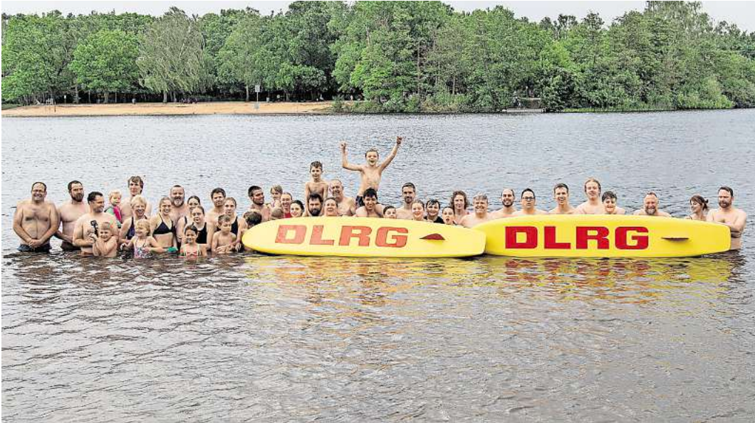
Bis zum 15. September lauft der Wachdienst am Silbersee.

Bis zum 15. September sorgen die ehrenamtlichen Rettungskrafte der DLRG jedes Wochenende fur die Sicherheit der Badegaste am Silbersee. Unbezahlt und in ihrer Freizeit leisten sie Erste Hilfe, uberwachen das Geschehen am Wasser und greifen im Notfall sofort ein, um Leben zu retten. Die Praesenz der Lebensretter ist an Wochenenden von 10 bis 18 Uhr durch das Hissen der DLRG-Flagge und einer rotgelben Flagge vor der Wasserrettungsstation erkennbar.