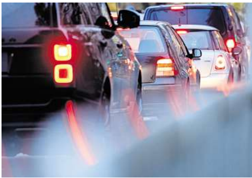
Fast eine Stunde Fahrt für 30 Kilometer - das nervt: Eine doppelte Haushaltsführung rechtfertigt ein anstrengender Arbeitsweg allerdings nicht automatisch.