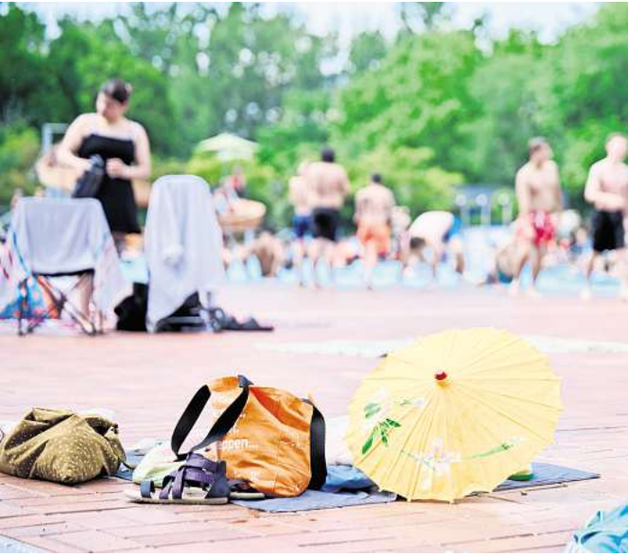
Wer seine Wertsachen im Freibad unbeaufsichtigt lässt, sollte wissen, dass die Hausratversicherung in der Regel nicht für einfache Diebstähle aufkommt.

Besser daher: abschließbare Spinde oder Locker in einem Gebäude nutzen, die Betreiber im Idealfall zur Verfügung stellen. Wenden Langfinger hier Gewalt an, um an die Wertsachen zu gelangen, handelt es sich um Einbruchdiebstahl, der von der Hausratversicherung abgedeckt ist. Werden Wertgegenstände unter Androhung von Gewalt herausgegeben, leistet die Hausratversicherung ebenfalls Ersatz zum Neuwert. Allerdings: Dem BdV zufolge bieten einige Versicherer inzwischen auch Hausrat-Tarife mit erweiterten Leistungen an, die mitunter auch einfachen Diebstahl bis zu einer bestimmten Entschädigungsgrenze einschließen. Versicherte tun daher gut daran, ihre bestehende Police sorgfältig zu prüfen und im Zweifel direkt beim Versicherer nachzufragen, ob und in welchem Umfang einfacher Diebstahl abgedeckt ist. (DPA)