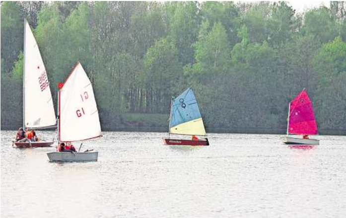
Optimisten-Boote und Teeny-Jollen stehen für die Kinder- und Jugendarbeit zur Verfügung.

14 Jahren) zu absolvieren. Am Segeltraining können Kinder ab sechs Jahren teilnehmen, die mindestens das Seepferdchen-Schwimmabzeichen haben. Wer Interesse oder weitere Fragen hat, kann sich unter der E-Mail-Adresse: seebaer@segelclub-passat.de oder per Telefon (0176) 55 91 07 14 melden. Weitere Infos befinden sich auf der Homepage www.segelclub-passat.de . Oder einfach mal mittwochs ab 18 Uhr im neuen Vereinsheim in der Emil-Berliner-Straße 22 vorbeischaun.