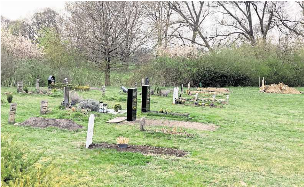
Die Anzahl der Gräber wächst: Seit rund drei Jahren sind auf dem Friedhof Grenzheide in Langenhagen muslimische Bestattungen möglich.

Zum 1. August 2021 hatte der Rat der Stadt Langenhagen eine Änderung der Friedhofssatzung beschlossen. Darin wurde auch die Möglichkeit der Tuchbestattungen aufgenommen – eine wichtige Voraussetzung. Denn damit wurde die Basis geschaffen, dass auch Menschen muslimischen Glaubens ihre Verstorbenen in Langenhagen gemäß ihrer Bestattungskultur beisetzen lassen können. Danach richtete die Stadt im westlichen Erweiterungsteil des Friedhofs Grenzheide das muslimische Gräberfeld ein