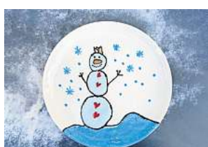
3. Platz: Irma Schlicker (Hannover)