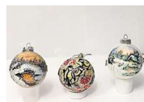
2. Platz: Rimma Schilmover (Laatzen)