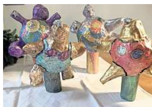
1. Platz: Romy Doecke (Hannover)