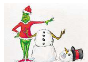
3. Platz: Ingo Stein (Wedemark)