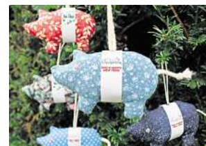
3. Platz: Laura Eicke (Hemmingen)