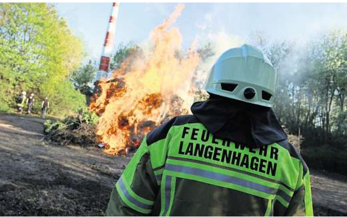
Auch in Godshorn brennt es wieder: Das Bild zeigt ein Osterfeuer aus der Vergangenheit vom Rodelberg.

Bald ist Ostern – und damit wird es Zeit für einen beliebten Brauch: Das Osterfeuer. Ein Überblick.