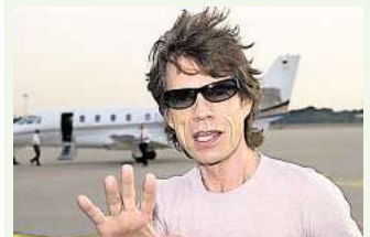
Er landete immer wieder in Langenhagen: Mick Jagger.