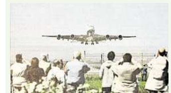
Erste Landung eines Airbus A380 in Langenhagen.