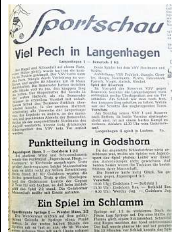
Schon im ersten Monat berichtete der Dorfbote über den TSV Godshorn.