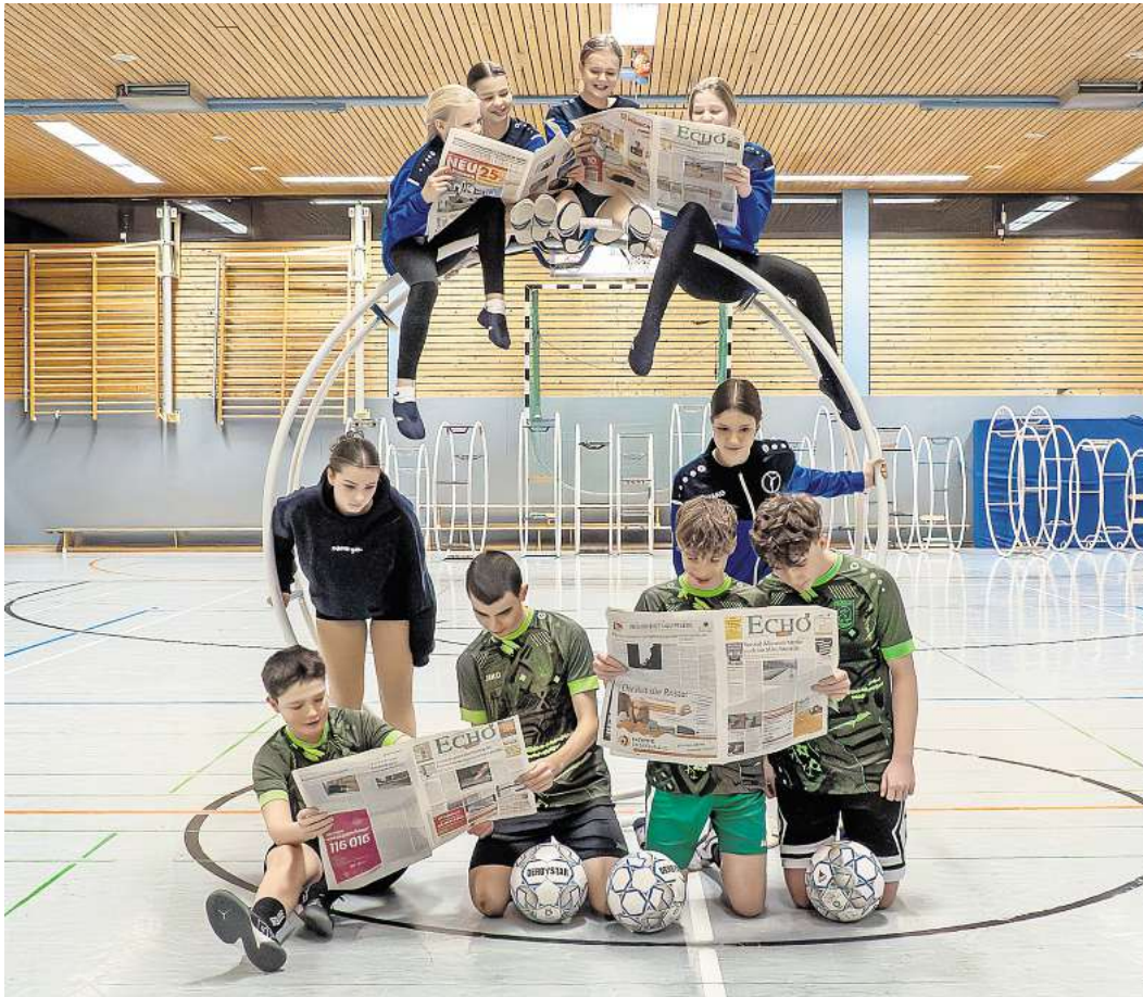
Das Langenhagener Echo begleitet den TSV Godshorn seit Jahrzehnten.