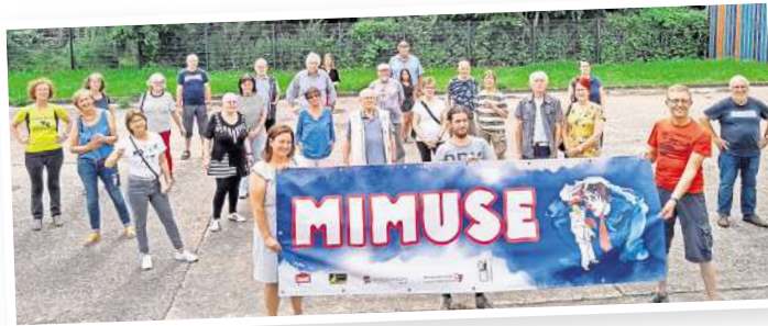
Das Team der Klangbüchse.

Im Jahr 1976 gründete der Bauingenieur im Stadtplanungsamt und spätere Kulturamtsleiter Udo Püschel im Stadtjugendring und in Zusammenarbeit mit der Jugendpflege die Arbeitsgemeinschaft Klangbüchse, mit der Aufgabenstellung, Folklorekonzerte und andere kulturelle Veranstaltungen für junge Leute zu organisieren. Der anfängliche Schwerpunkt auf der Musik gab der Klangbüchse auch gleich ihren Namen. Deren allererstes Folklorekonzert im Freizeitheim Langenhagen ging am 24. September 1976 mit lediglich zwei zahlenden Zuschauern über die Bühne. Anlässlich der Einweihung einer Fußgängerbrücke über die Autobahn im Jahr darauf veranstaltete die Klangbüchse auf Wunsch der Stadt und mit einem Zuschuss versehen ihr erstes richtiges Folklorefestival, das Sunday Folkmeeting am Silbersee. Und da kamen schon rund 800 Besucher, auch wenn die Veran-