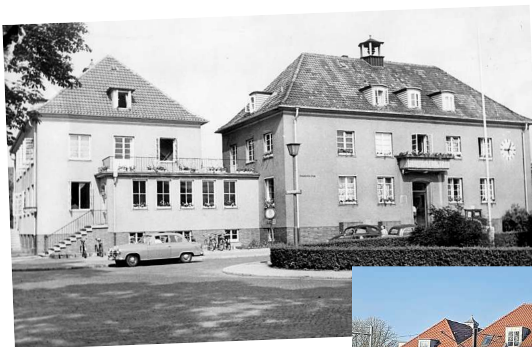
Historische Fotos aus Langenhagen: Altes Rathaus 1960.

Da der Dorfbote und später das Langenhagener Echo in den ersten Jahren von der Gemeinde herausgegeben wurde, hatte es seinen Gründungssitz im Rathaus. Wer dem Dorfboten Nachrichten zur Veröffentlichung sandte, schickte sie direkt in das Rathaus, wo der Gemeindedirektor auch als Herausgeber fungierte.