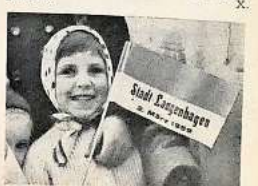
Die strahlenden Augen dieses kleinen Mädchens sprechen für alle.

versäumt worden, den ersten Stadtbürger Langenhagens vorzustellen: er heißt Ralf Pralle und wurde am 2. März 1959 um 12.15 Uhr in der neuen Stadt Langenhagen geboren.