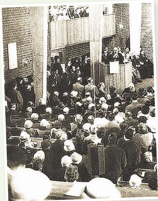
Eine schnell wachsende Stadt brauchte auch neue Kirchen. Die Emmaus-Kirche in Brink/Wiesenaue wurde 1961 eingeweiht.