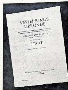
Der Text der Urkunde: Verleihungsurkunde

Und auch die Sonne sandte ihre strahlenden Glückwünsche — ihr Lächeln an diesem Tage wollen wir getrost als gutes Omen deuten. Zu guter Letzt soll nicht