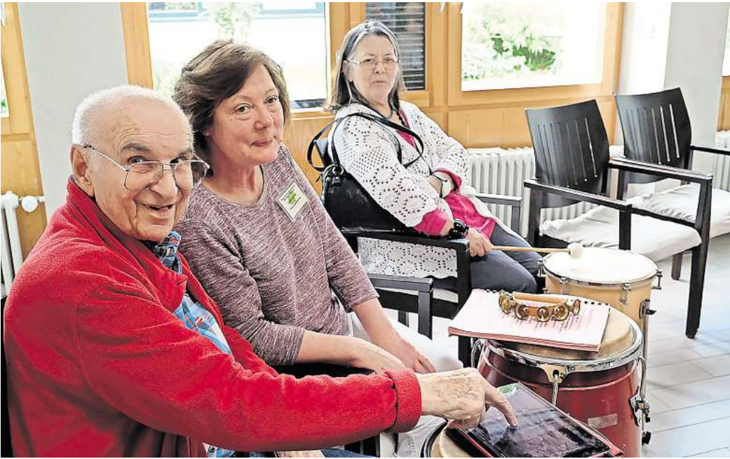
Das neue „Lebenswerk 3 “-Projekt startet im Frühjahr 2025

Eigene musikalische Talente entdecken, selbst künstlerische Werke schaffen und kulturelle Erlebnisse mit anderen teilen – dazu haben gesundheitlich und mobilitätseingeschränkte ältere Menschen kaum Gelegenheit. Das will die Landesarbeitsgemeinschaft Rock in Niedersachsen e.V. (LAG Rock) mit einem neuen Projekt ändern. „Lebenswerk 3 “ ermöglicht Bewohnerinnen und Bewohnern von Pflegeheimen die kulturelle Teilhabe durch den Einsatz von digitalen Medien und analogen Musikinstrumenten. Aus Lebenserinnerungen entstehen mithilfe von Musik-Apps zum Beispiel Songs oder Hörspiele, die in Digitalkonzerten den Teilnehmenden der anderen Einrichtungen präsentiert werden. Angeleitet werden die wöchentlichen Kurse über drei Jahre hinweg von Tandem-Teams aus musikpädagogischen Profis und jungen Assistenzkräften. Die Workshops in den Einrichtungen werden im Frühjahr 2025 beginnen. Die Seniorinnen