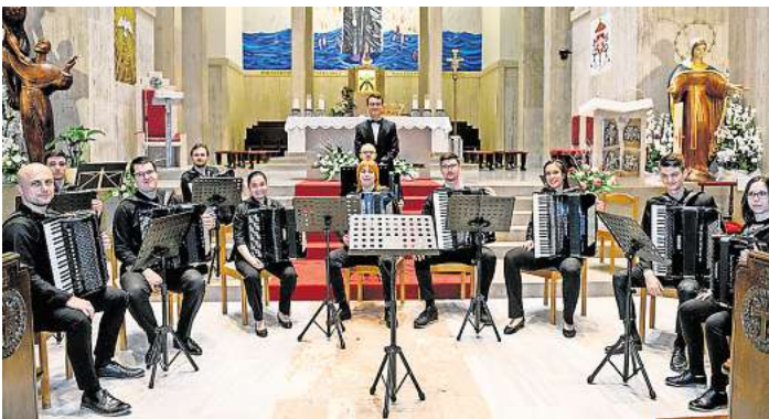
Das Akademische Akkordeonorchester aus Kroatien gibt ein Gastspiel in Bissendorf.

Das renommierte Akademische Akkordeonorchester „Ivan Goran Kovacevic“ aus Zagreb, eines der erfolgreichsten Amateurensembles Europas, gibt ein Benefizkonzert zugunsten der HAZ-Weihnachtshilfe. Der Eintritt zu diesem außergewöhnlichen Konzert ist kostenlos, jedoch wird um eine Spende gebeten, um die wichtige Arbeit der Weihnachtshilfe zu unterstützen. Das Orchester befindet sich auf Gastspiel in Hannover und