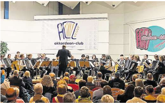
Der ACL feierte einen fulminanten Konzertabend.

Das Akkordeonquintett des Ditzinger Handharmonika Clubs, unter der Leitung von Martin Spieß, verzauberte die Zuhörer mit einem breiten Repertoire. Mit beeindruckender Virtuosität interpretierten sie Stücke wie Motion Trio's „Happy Band“, die schwungvolle Rumba „Cubano-la“ und den Pop-Klassiker „I'm so excited“. Den krönenden Abschluss ihres Auftritts bildete das furiose „Espana Cani“, das stürmisch bejubelt wurde.