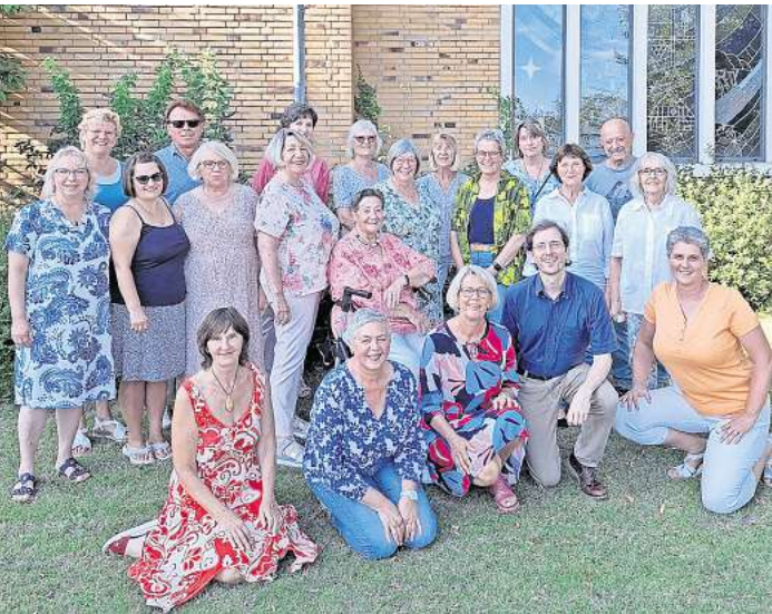
Hat ein umfangreiches und abwechslungsreiches Programm für das Konzert am 13. Oktober zusammengestellt: der Chor "Voices of Joy".