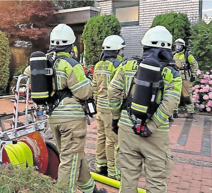
Saunabrand in Langenhagen: Die Feuerwehr muss am Freitagabend am Hartliebweg löschen.

lüftern und einer Abluftöffnung wurde der Brandrauch aus dem Gebäude gedrückt, teilt die Feuerwehr Langenhagen mit. Währenddessen wurden fünf leicht verletzte Personen mit Verdacht auf eine Rauchgasvergiftung vom Rettungsdienst an der Einsatzstelle behandelt. Ein Bewohner musste letztlich ins Krankenhaus gebracht werden. Die Polizei hat die Ermittlungen zur Brandursache aufgenommen. Die Schadenshöhe steht noch nicht fest. Unter der Einsatzleitung von Langenhagens Zugführer Karsten Patz waren 26 Feuerwehrkräfte mit fünf Fahrzeugen für rund eineinhalb Stunden im Einsatz.