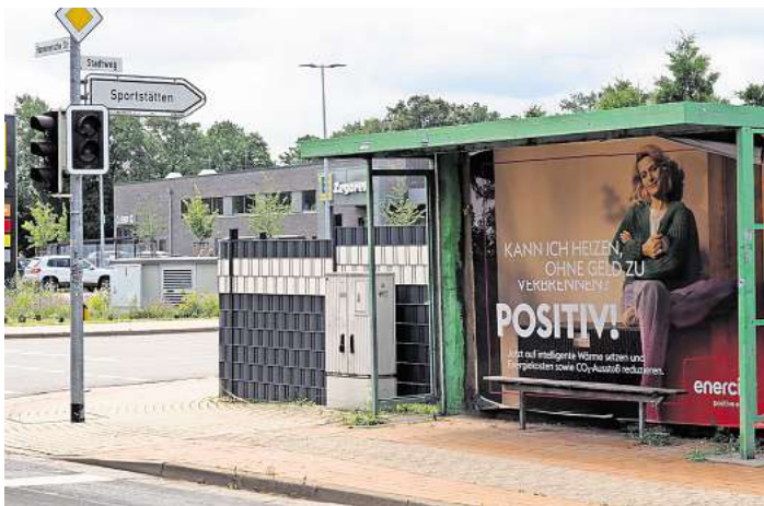
Verwaist: An dieser Haltestelle hat schon länger kein Bus mehr gestoppt - das soll sich bald ändern.

Geplant ist, dass ab dem Fahrplanwechsel wieder die Linie 461 fährt. Diese soll dann vom Bereich Krähenberg im Norden der Ortschaft vorbei am Edeka-Markt bis zum Nordhafen in Hannover fahren, wo es einen Anschluss an die Stadtbahn gibt. Früher gab es diese Linie schon einmal – doch als der Edeka-Markt eröffnet wurde, war die