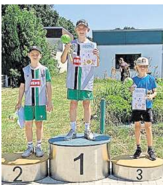
Die drei Erstplatzierten.

Dort nahmen insgesamt 14 Kinder und Jugendliche zwischen sieben und 14 Jahren unter Anleitung von Aufsichtspersonen an folgenden Wettbewerben teil: DJK Sparta – Torschuss-Geschwindigkeitsmessung. Wer erreichte die höchste Geschwindigkeit beim Schuss auf das Tor? TV Langenhagen – Tri-Tennis-Übungswand. Die häufigste Anzahl von Schlägen nacheinander wurde gewertet. RC Blau-Gelb – Watt Messung auf einem Spezialfahrrad. Die höchste Energieleistung wurde gemessen. SV Langenforth – Schießen mit dem Blasrohr. Die größte Punktzahl wurde bewertet. Segelclub Pasat – Spaß-Segelschule, Knotenübungen. Wer schafft die meisten Knoten in einer bestimmten Zeit? Die Platzierung entschied über die vergebenen Punkte für