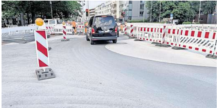
Der Verkehr läuft jetzt momentan einspurig Richtung Norden über den Kreisel.