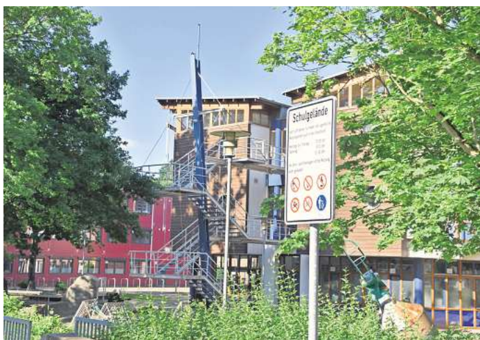
Wird in Teilen neu gebaut: die IGS Süd an der Angerstraße.

Sie gehören zu den insgesamt 390 geförderten Schulen im Land Niedersachsen, die anhand eines sozialdatenbasierten Indexes ausgewählt wurden. Bei diesem spielt unter anderem eine Rolle, wie viele Schülerinnen und Schüler einen Migrationshintergrund haben und wie viele aus einkommensschwachen Haushalten kommen. Auch der sonderpädagogische Unterstützungsbedarf wurde eingerechnet, die Unterrichtsversorgung sowie wie hoch der Anteil der Schülerinnen und Schüler ist, die die Schule zunächst ohne Abschluss verlassen. Durch diese Indikatoren konnten