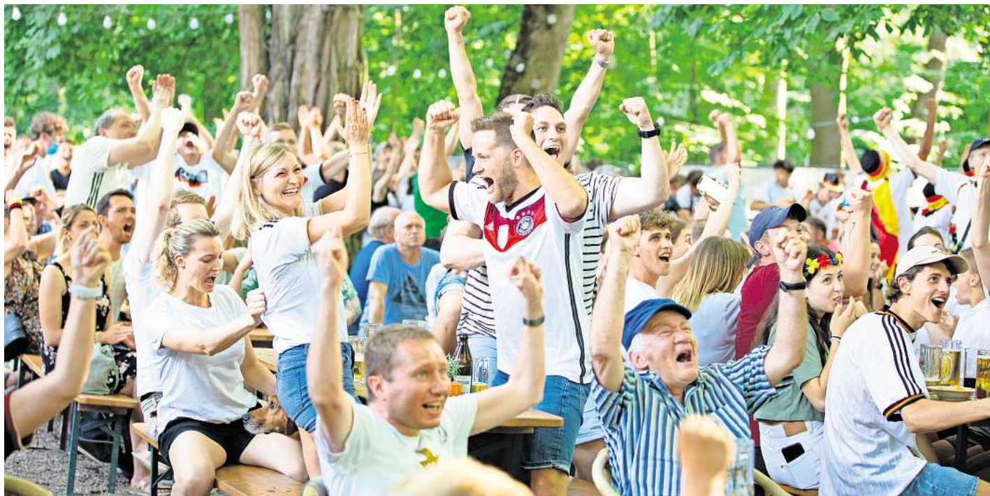
Public Viewing bei der EM ist ein Stimmungsgarant. Im CCL wird es daher auch diesmal angeboten.

Das CCL zeigt alle deutschen Vorrundenspiele kostenlos und draußen.