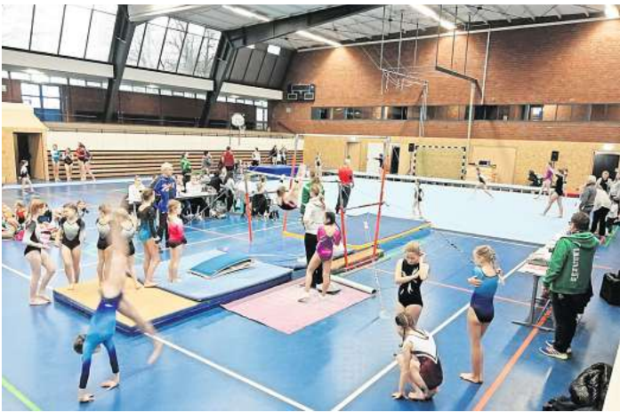
Soll für mehr als ein Million Euro saniert werden: Die Sporthalle der Leibniz IGS und der im Sommer auslaufenden Robert-Koch-Real-schule.

Nachdem feststand, dass es zumindest in den nächsten Jahren nichts wird mit der neuen Halle an der Rathenaustraße, hatte die Stadtverwaltung im Juni 2023 im technischen Schulbauausschuss des Rates über laufende und angedachte Baumaß-