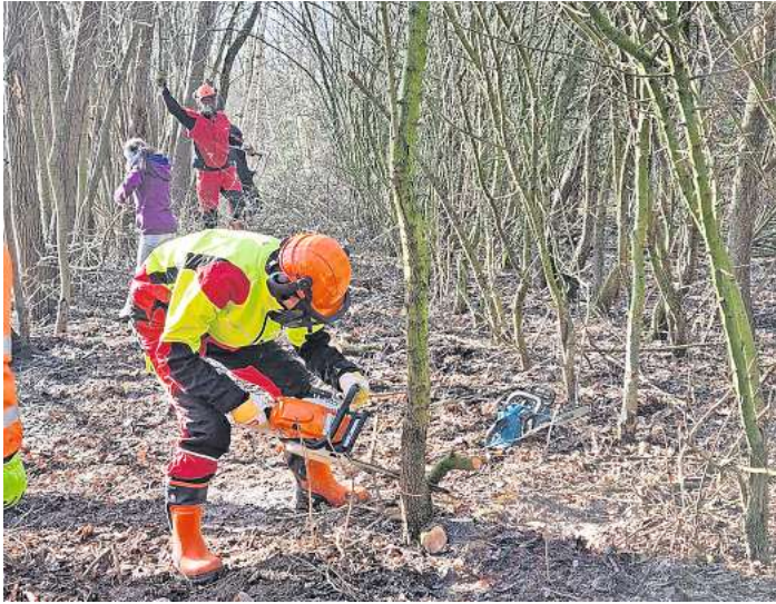
Mit vereinten Kräften machen sich die NABU-Akteure an den Bäumen und Sträuchern zu schaffen.

Dadurch werden die Gewässer zum Lebensraum für Amphibienarten, die die Gewässer als Laichmöglichkeit nutzen können und auch für Libellen. Die Südseite des nördlichen Gewässers wurde bereits vergangenes Jahr nahezu freigelegt und so widmete sich die Gruppe nun der Nordseite. Da auch hier das Hochwasser nicht zu knapp kam rüsteten sich alle mit Gummistiefeln aus und konnten so auch dieser Herausforderung entgegenreten. Bereits beim ersten Termin im Januar wurde viel geschafft. Mithilfe von Handsägen und Astscheren wurden die ersten zwei Reihen von Büschen und Sträuchern die am Ufer standen entfernt, um mehr Platz für das Fällen der am Ufer gewachsenen Bäume zu schaffen. Bei diesem Termin freute sich die Gruppe umso mehr ein neues Gesicht begrüßen zu dürfen, denn wie man so schön sagt: