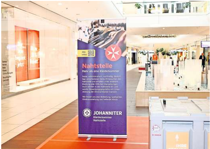
Die Boxen am CCL-Brunnen gehören zur Johanniter-Kleider-Sammlung.

nötigen. Zwei Boxen werden auf der Fläche im Erdgeschoss vor dem Brunnen aufgestellt. Die Kunden können ganz einfach die Winterjacken einwerfen. Altkleider sollten sauber in die Sammlung gegeben werden. Das Centermanagement sammelt die Jacken und übergibt diese dann der Kleiderkammer der Johanniter. Unabhängig davon können Sachspenden weiterhin Geschäft fairKauf im CCL oder direkt in der Kleiderkammer „Nahtstelle“ der Johanniter am Bahnhof Langenhagen Mitte, Brüsseler Straße 1, abgegeben werden. Für Interessierte ist die „Nahtstelle“ dienstags, mittwochs und donnerstags von 10 Uhr bis 12 Uhr und von 16.30 Uhr bis 18.30 Uhr geöffnet.