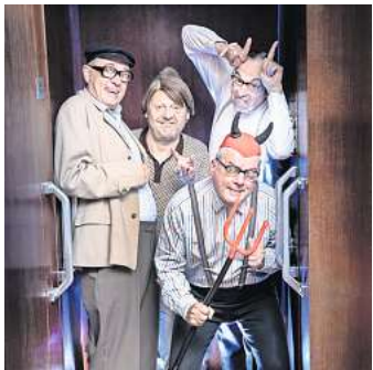
„Fahr zur Hölle, Baby“ heißt Herbert Knebels neues Programm.

LANGENHAGEN. Am Donnerstag, 18. Januar, um 20 Uhr ist Herbert Knebel mit seinem Affentheater und dem Programm „Fahr zur Hölle, Baby!“ zu Gast im Theatersaal. Es gibt noch Resttickets.