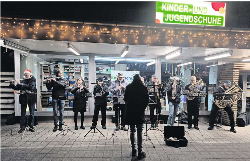
Das Blasorchester der Stadt Langenhagen lädt traditionell zum ECHO-Weihnachtskonzert auf den Theissen-Platz ein.

LANGENHAGEN. Bereits eine lange Tradition hat das ECHO-Weihnachtskonzert des Blasorchesters der Stadt Langenhagen. Mit fröhlichen Weihnachtsliedern empfangen die Musikerinnen und Musiker Jahr für Jahr Gottesdienstbesucher und andere Interessierte auf dem Platz gegenüber der Elisabeth-Kirche. Nachdem das Konzert 2020 und 2021 aus bekannten Gründen ausfallen musste, wurde diese wunderbare Tradition im letzten Jahr erfolgreich wiederbelebt. Das Blasorchester der Stadt Langenhagen hat sich dazu Verstärkung aus zwei befreundeten Orchestern geholt: aus dem Young Spirit Orchestra (YSO) aus Kaltenweide und aus dem Musikverein Godshorn. Die Musikerinnen und Musiker hatten Spaß am gemeinsamen Musizieren und das Konzert ist auch bei den Zuhörerinnen und Zuhörern sichtbar und hörbar gut angekommen. So hat sich daraus eine neue Tradition entwickelt, und schnell wurde klar, dass das ECHO-Weihnachtskonzert auch in diesem Jahr als Gemeinschaftsprojekt stattfinden soll.