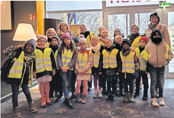
Im Kino wurde viel gelacht und sich auch ein wenig gefürchtet.

sich am 16. Dezember mit dem Bus auf den Weg. Beim Disney Film „WISH“ wurde mit Popcorn und Fanta viel gelacht und sich auch ein wenig gefürchtet. Aber am Ende haben alle verstanden, wie wichtig es ist, an seine Träume zu glauben.