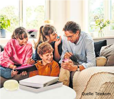
Für 15.250 Haushalte und Unternehmen baut die Telekom ihr Glasfaser-Netz aus.

Und so einfach geht's Eine kurze Online-Abfrage über telekom.de/glasfaser-langen-hagen zeigt, ob Ihre Adresse im Ausbaubereich liegt. Gehört sie dazu, können Sie den Glasfaser-Anschluss bestellen. Zur Nutzung des Haus-Anschlusses ist außerdem ein Glasfaser-Tarif notwendig. Bestellung ohne Tarife werden aktuell nicht gebaut, da Tarif-Bestellung priorisiert werden. Die Telekom bietet Glasfaser-Tarife in verschiedenen Geschwindigkeiten an. Auch hier profitieren Sie aktuell von attraktiven Sonderkonditionen. Die Glasfaser-Tarife der Telekom unterscheiden sich preislich nicht von den herkömmlichen Internet-Tarifen. Es gilt: gleiche Geschwindigkeit, gleicher Preis. Dabei profitieren Sie mit Glasfaser von einer höheren Stabilität bei der Nutzung Ihres Anschlusses, unabhängig davon, wie viele Nachbarn gerade im Netz unterwegs sind. Zudem können Sie mit dem Glasfaser-Anschluss ganz einfach, Ihren Bedürfnissen entsprechend,