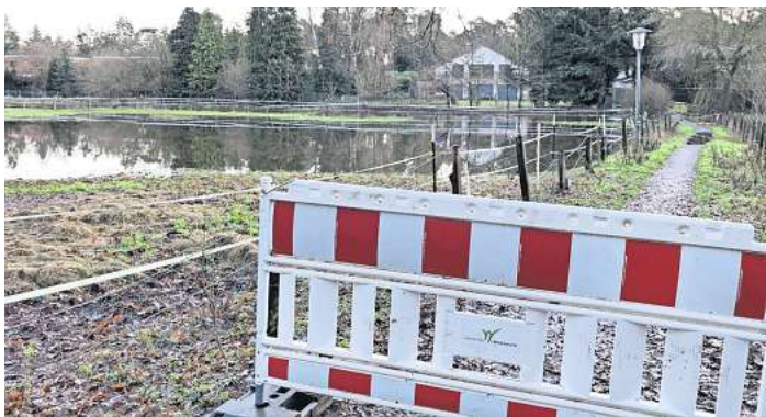
Gesperrt: Das Flüschen Wietze ist über die Ufer getreten, die Fußgängerbrücke hinter der ehemaligen Christophorus-Kirche in Bissendorf-Wietze ist gesperrt.

Wegen des Starkregens war der Grundwasserspiegel in der Wedemark über Weihnachten und Neujahr stark angestiegen, weshalb viele Keller mit Wasser vollgelaufen waren. Weil das zum Handeln zwingt, hat die SPD-Fraktion im Ausschuss für Klimaschutz, Umwelt und Gebäude einen Antrag gestellt, der die Verwaltung beauftragt, eine Starkregenhinweiskarte samt Oberflächenabflussmodell für die Gemeinde zu erstellen. Beides soll nach Vorstellungen des Ausschusses mithilfe einer Förderung, nämlich der „Richtlinie Kommunaler Klimaschutz“ der Region Hannover, finanziert werden. In Folge des Klimawandels nehmen die Jahresniederschläge zwar ab, gleichzeitig nehmen aber Starkregenereignisse immer mehr zu. Bei Starkregenereignissen fällt innerhalb weniger Stunden eine Niederschlagsmenge, die sonst über Monate verteilt zu erwarten wäre. Im Antrag werden Beispiele genannt: „Dortmund 2021, Hamburg 2022, Berlin 2023, bei denen der Starkregen Fahrzeuge beschädigte und in Bauwerken extrem teure Schäden verursacht hatte.“ Auch die Überflutungen im Ahrtal 2021 seien auf Folgen des Klimawandels zurückzuführen. Aber wie definiert man eigentlich einen Starkregen? Der Deutsche