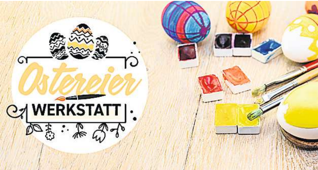
„Ein Ei ausblasen, den Tuschkasten aufklappen und malen“, heißt die Devise.

LANGENHAGEN/WEDE-MARK. Es ist eine schöne Tradition. Kurz vor Ostern werden in vielen Familien in der Region Hannover Eier bunt und fantasievoll bemalt. Diese kleinen Kunstwerke schmücken dann Büsche, Bäume sowie Ostergestecke – und wir wollen so viel Kreativität