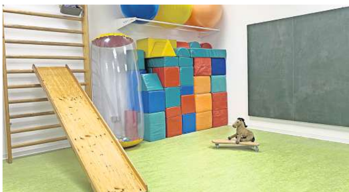
Einer der ansprechenden Behandlungsräume am neuen Standort.