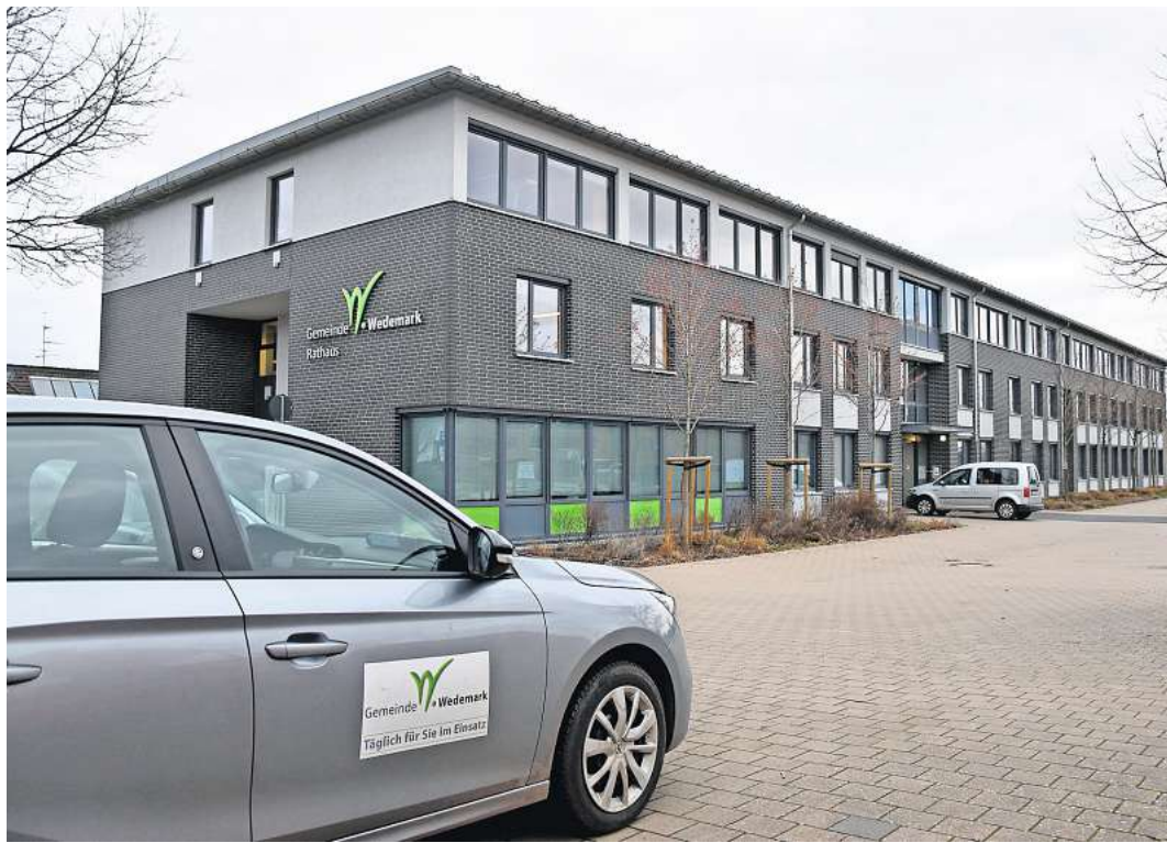
Der Platz reicht nicht mehr aus: das Rathaus in Mellendorf, Sitz der Wedemärker Gemeindeverwaltung.