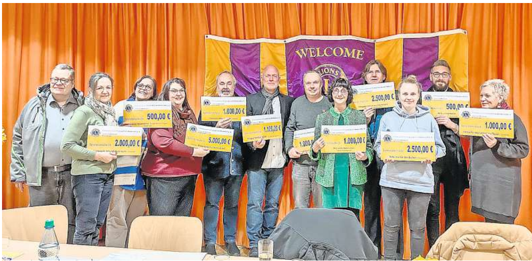
Freudige Gesichter bei der Spendenübergabe. 19.100 Euro spendete der Lions Club Wedemark an gemeinnützige und soziale Projekte.

Eine Spende von 2.000 Euro geht in diesem Jahr an den Kinderschutzbund Wedemark. „Von der Spende finanzieren wir einen mehrwöchigen Sommer-Schwimmkurs für zehn bis fünfzehn Kinder im Grundschulalter, ihr Abzeichen und eine Saisonkarte für das Freibad in Mellendorf. Dadurch, dass immer weniger Schwimmunterricht an den Schulen stattfindet, ist dieses Angebot für finanziell benachteiligte Kinder eine seltene und umso wichtigere Möglichkeit schwimmen zu lernen. Wir freuen uns sehr, dieses Angebot durch die wiederholte Spende des Lions Club Wedemark aufrechterhal-