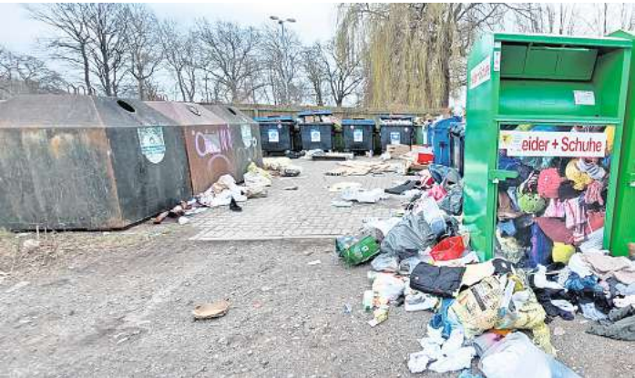
Vermüllung an der Wertstoffstation: Die Container für Altglas, Altkleider und Altpapier am Freizeithaus sind umgeben von Müllresten, die auf dem Boden liegen.