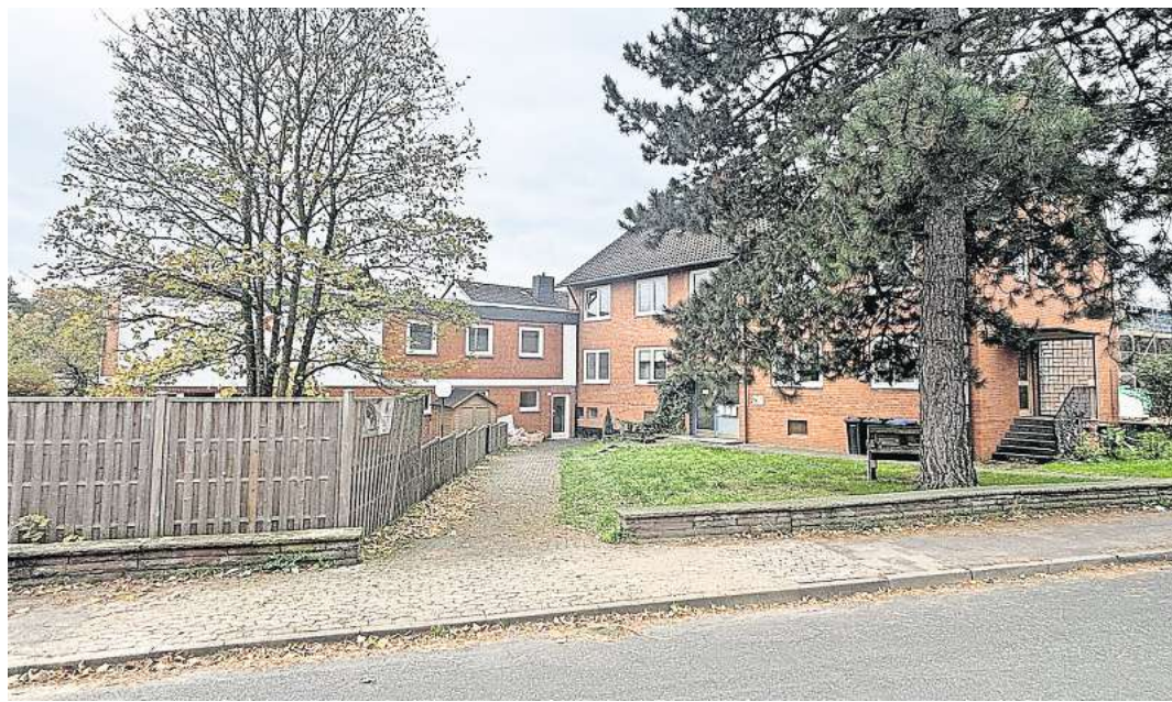
Neue Außenstelle der Gemeindeverwaltung: Das Gebäude Am Sande wird für 15 Büroarbeitsplätze umgebaut.

Für den Rathausanbau, der nach Zychlinskis Überzeugung am Ende der Untersuchung stehen wird und für den er 2025 die politische Entscheidung herbeiführen will, rechnet der Bürgermeister mit Kosten in Millionenhöhe. „Das wird aber kein Luxusbau. Es wird am Ende das übliche Wedemark-Understatement.“