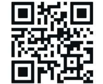
Über diesen QR-Code kann das Bild direkt hochgeladen werden.

Aus allen Ostereiern werden von unseren Lesern in einer großen Online-Abstimmung die schönsten Kunstwerke gewählt. Auf den Absender des schönsten Ostereis (in der Ü12-Kategorie) wartet ein personalisiertes One-Liner Portrait. Beide Preise werden von SOME.LIKE.IT gesponsert. Also: Schnell ein Ei ausblasen, den Tuschkasten aufklappen und malen. Wir wünschen viel Erfolg – und natürlich vor allem sehr viel Spaß bei dieser tollen Tradition!