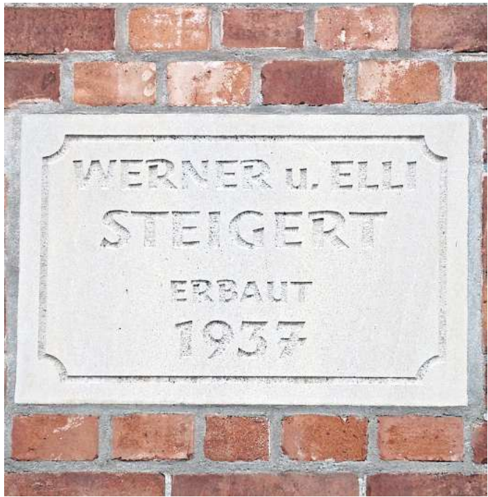
Was wird im Monat März gesucht?