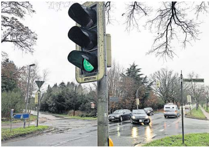
Problematischer Verkehrsknoten: Die Kreuzung in Schlage Ickhorst auf der L190 soll eine Linksabbiegerspur Richtung Bissendorf erhalten.

Für die Verkehrssicherheit könnten Geschwindigkeitsbegrenzungen in Erwägung gezo-