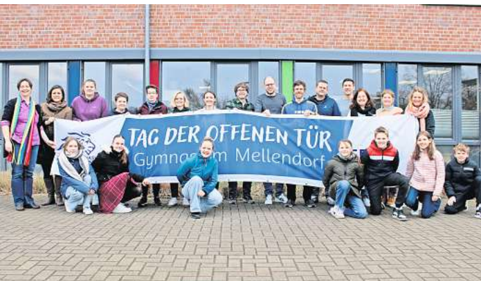
Das Gymnasium Mellendorf will sich am Freitag, 1. März, von seiner besten Seite zeigen.

ternrat, den Förderverein der Schule oder die Schülervertreter kennen lernen können. Letztere werden alkoholfreie Cocktails servieren und dabei dem Nachwuchs die eine oder andere Anekdote aus dem Schüleralltag am Gymnasium Mellendorf erzählen. Neben den Unterrichtsfächern werden sich auch die Arbeitsgemeinschaften der Schule vorstellen und da hat das Gymnasium einiges zu bieten: Sämtliche Musikensembles, das Schattentheater, die Fahrradwerkstatt, die Darts- und die Survival-AG, die Schachspieler, die Schulgärtner oder die Robotik-Schüler brennen darauf, neue Mitglieder zu bekommen. Grundlegende Informationen zum Fächerangebot der Schule, zum Ganztagskonzept oder zum Anmeldeprozess gibt die Schulleitung im Laufe des Nachmittags innerhalb kürzerer Präsentationen bei diese Veranstaltung.