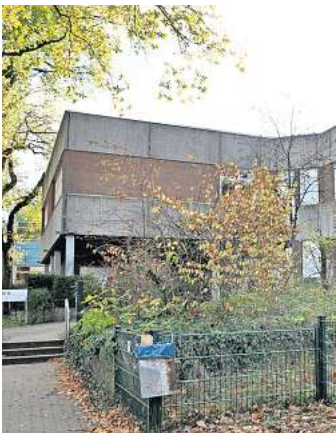
Zentrum für Ehrenamtliche und Gruppen: Das Mehrgenerationenhaus am Gilborn 6 in Mellendorf hat im Gebäude der ehemaligen Berthold-Otto-Förderschule Platz gefunden.

MELLENDORF (kra). Sie haben offenbar eine illegale Party gefeiert: Zehn Personen sind ins Mehrgenerationenhaus in Mellendorf eingedrungen und lösten in der Nacht zu Sonntag, 18. Februar, einen Großeinsatz der Polizei aus. Eine Gruppe Menschen im Alter zwischen 18 und 32 Jahren hat in Mellendorf einen Großeinsatz der Polizei ausgelöst. Gegen 0 Uhr in der Nacht zu Sonntag, 18. Februar, wurden über eine Überwachungskamera mehrere Personen gesichtet, die sich im Gebäude der ehemaligen Berthold-Otto-Schule im Gilborn aufhielten, in dem jetzt unter anderem das Mehrgenerationenhaus sowie die Kita Wederacker untergebracht sind. Als die Polizei eintraf, ergab sich der Verdacht, dass sich noch weitere Personen