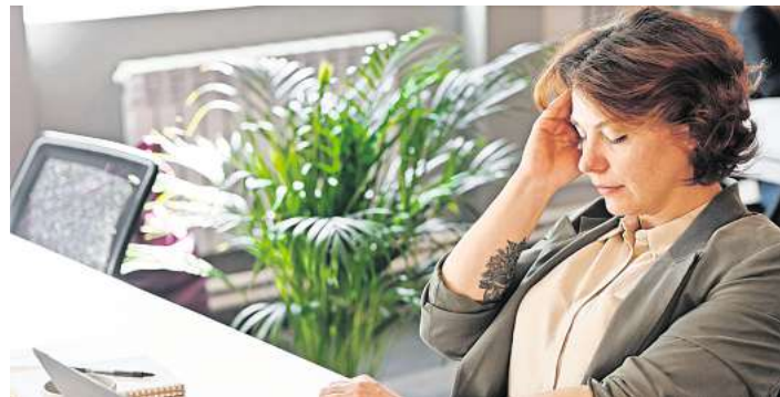
Manche Kopfschmerzen haben ihren Ursprung in überlasteten Augen.

Zeigen sich Beschwerden dieser Art, sind Gänge zum Augenarzt und Optiker anzuraten. Sind medizinische Ursachen ausgeschlossen, kann eine Sehhilfe während der Computerarbeit helfen und wieder zu einer Beschwerdefreiheit führen. LPS/AM