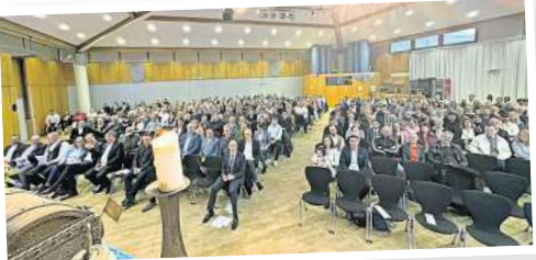
Rund 400 Gäste sind zur Winterfreisprechung der Kreishandwerkerschaft im Burgdorfer Stadthaus gekommen.