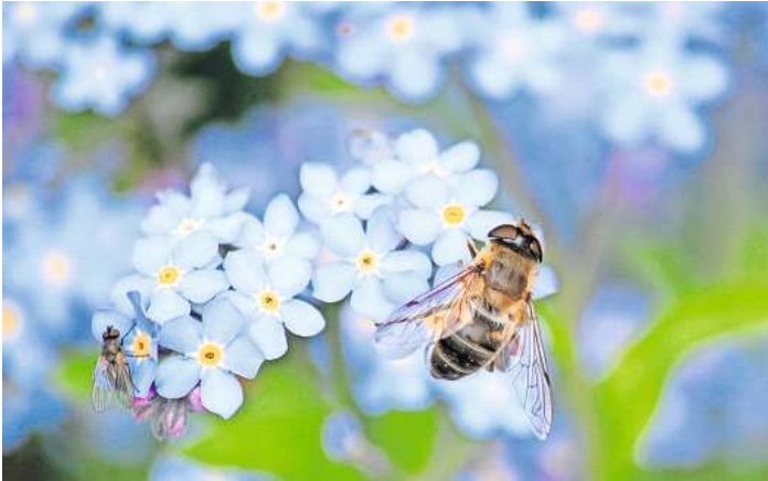
Mit dem eigenen Garten kann man zum Schutz der Natur beitragen.

Bienen nehmen die Farben und Muster der Blüten anders wahr. Veilchen und Margeriten, die für den Menschen einfarbig erscheinen, locken die Bienen mit einem unverkennbaren Muster an. Ein Garten, der mit einer Artenvielfalt aus Stauden, Sträuchern und Gehölzen besticht, wird für zahlreiche