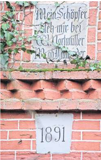
Wo ist das?

ELZE. Damit alle in Zukunft mit noch offeneren Augen durchs Dorf laufen, veröffentlicht der Verein Dorfbild Elze jeden Monat ein Suchbild mit einem Detail eines Hauses oder einer Hofanlage. Dieses Merkmal ist von der Straße aus zu erkennen, sodass das jeweilige Grundstück nicht betreten werden muss. Das Suchbild hängt auch im Schaukasten des Vereins Dorfbild Elze, Wasserwerkstraße 21/21a. Die richtige Lösung kann bis zum Monatsende per E-Mail geschickt oder in den Briefkasten von Wasserwerkstr. 21a oder 23 eingeworfen werden. Der Gewinner oder die Gewinnerin wird unter allen Einsendenden durch Los bestimmt und bekommt einen kleinen Preis (Naturalien aus Elze). ehtheilmann@dorfbild-elze.de geschickt werden. In die Veröffentlichung vom vergangenen Sonnabend hatte sich ein Fehler eingeschlichen. Dieses Bild ist das richtige Motiv für Februar.