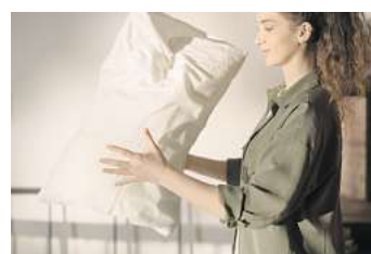
Mit speziellen Bezügen können Allergiker die Belastung durch Hausstaubmilben reduzieren.

Hausstaubmilben sind so winzig, dass man sie mit dem bloßen Auge nicht sehen kann. Trotzdem kommen sie in jedem Haushalt, insbesondere im Schlafzimmer, vor und ernähren sich dort von abgestorbenen Hautschuppen. An sich sind Hausstaubmilben, im Gegensatz zu anderen Gattungen, ungefährlich, da sie weder Bisse noch Stiche verursachen. Allergiker sehen das allerdings anders. Mit Niesen, Schnupfen und Husten kann sich eine Hausstauballergie äußern. Dabei reagiert das Immunsystem überempfindlich auf den Kot der kleinen Tierchen. Die Reak-