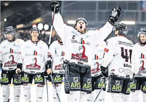
Die Scorpions setzten sich auch dieses Mal wieder gegen den Lokalrivalen durch.

nahezu sicher Oberliga-Nord Meister geworden, da es für den direkten Verfolger in der Tabelle äußerst unwahrscheinlich ist (zwölf Punkte und 36 Tore Vorsprung auf den zweiten Tabellenplatz), in den noch ausstehenden vier Spielen bis zum Start in die Playoffs die Scorpions von der Tabellenspitze zu verdrängen. Am kommenden Sonntag, 18. Februar, um 19 Uhr treffen die Scorpions im vorletzten Heimspiel der regulären Saison in der ARS Arena auf die KSW Icefighters Leipzig.