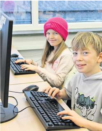
Medien spielten in der Projektwoche auch eine große Rolle.