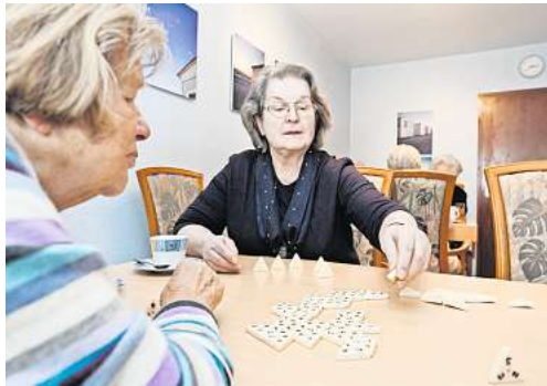
Seniorentreffs sorgen für Kommunikation und Spaß.

Hierzu können folgende gehören: gesellige Kaffeetisch-Runden, Tanz- und Bewegungskurse, Spielenachmittage, Computerkurse, sportliche Aktivitäten wie Gymnastik, Tai-Chi oder Yoga sowie Gedächtnistraining, diverse Vorträge oder gemeinsames Singen. Darüber hinaus bieten einige Einrich-