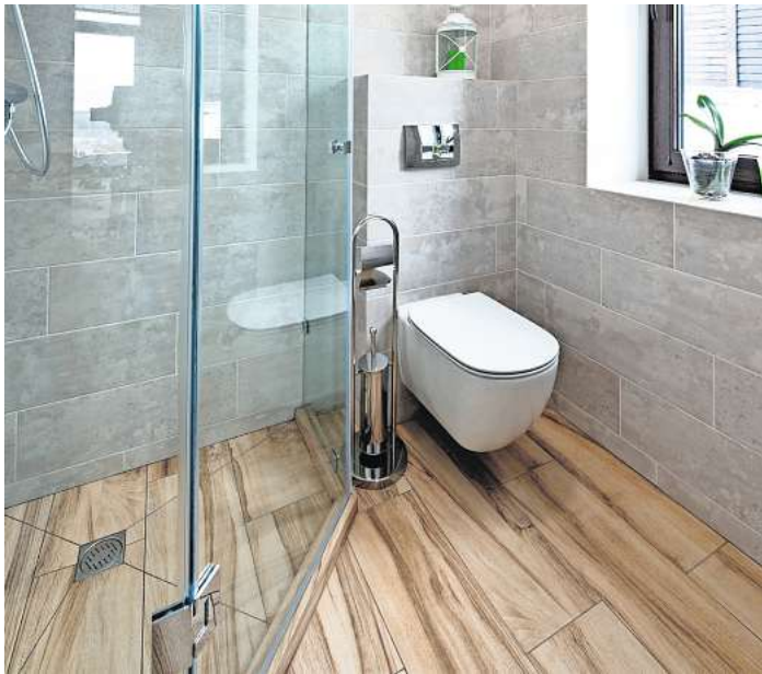
Beständig und robust: Fliesen in Holzoptik eignen sich auch fürs Bad.

Anders bei Fliesen, denn der große Vorteil besteht darin, dass ihre Oberfläche sehr leicht zu reinigen ist und Fliesen eine hohe Widerstandsfähigkeit aufweisen. Es war nur logisch, dass man beides miteinander verbindet: Fliesen in Holzoptik. Sie strahlen die Wärme, Gemütlichkeit und den Stil eines Holzfußbodens aus, bringen aber gleichzeitig die vielen Vorzüge der