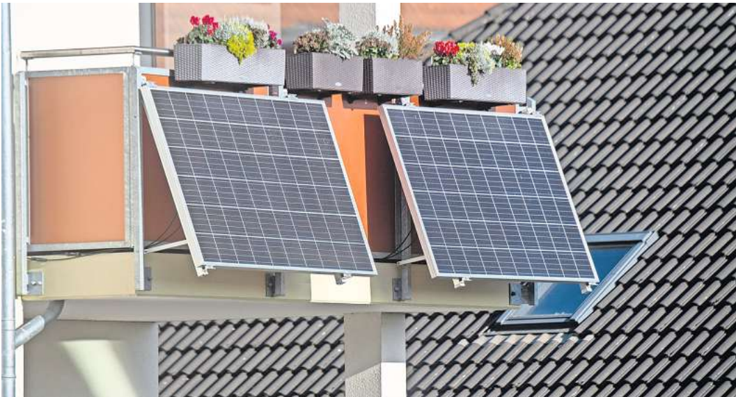
Solarmodule für ein sogenanntes „Balkonkraftwerk“ hängen an einem Balkon. Dieses Symbolbild gibt einen Vorgeschmack auf die Fördermaßnahmen in der Wedemark.

bekommen für den Stromspeicher einen weiteren Zuschuss von 100 Euro. Der größte Vorteil eines Speichersystems ist, dass man so den Eigenverbrauch steigern kann. Voraussetzungen für die Förderung in der Wedemark sind, dass die Anlage im Gemeindegebiet installiert und ans Stromnetz angeschlossen wird. Zudem müssen Bürgerinnen und Bürger die Solarmodule im Marktstammdatenregister der Bundesnetzagentur unter www.marktstammdatenregister.de/MaStR registrieren lassen. Außerdem sollten geförderte Balkonanlagen eine Leistung von 600 bis maximal 800 Watt haben. Für Stromspeicher von Photovoltaikanlagen auf dem Dach gibt es nun einen Zuschuss von 300 Euro. Auch dafür sind die Registrierung im Marktstammdatenregister der Bundesnetzagentur, die Installation im Gemeindegebiet und der Anschluss ans Stromnetz notwendig. Die PV-Anlagen sollten eine Leistung von mindestens vier Kilowatt-Peak (kWp) aufweisen. Und der geförderte Speicher muss ebenfalls mindestens vier Kilowattstunden (kWh) haben. Bürgermeister Helge Zychlinski (SPD) sagt: „Mit der Förderung von Stecker-Solaranlagen und den dazugehörigen Speichern setzen wir als Gemeinde ein starkes Zeichen für eine nachhaltige