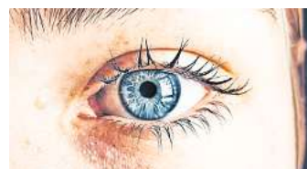
Blaue Augen haben eine sehr geringe Pigmentierung.