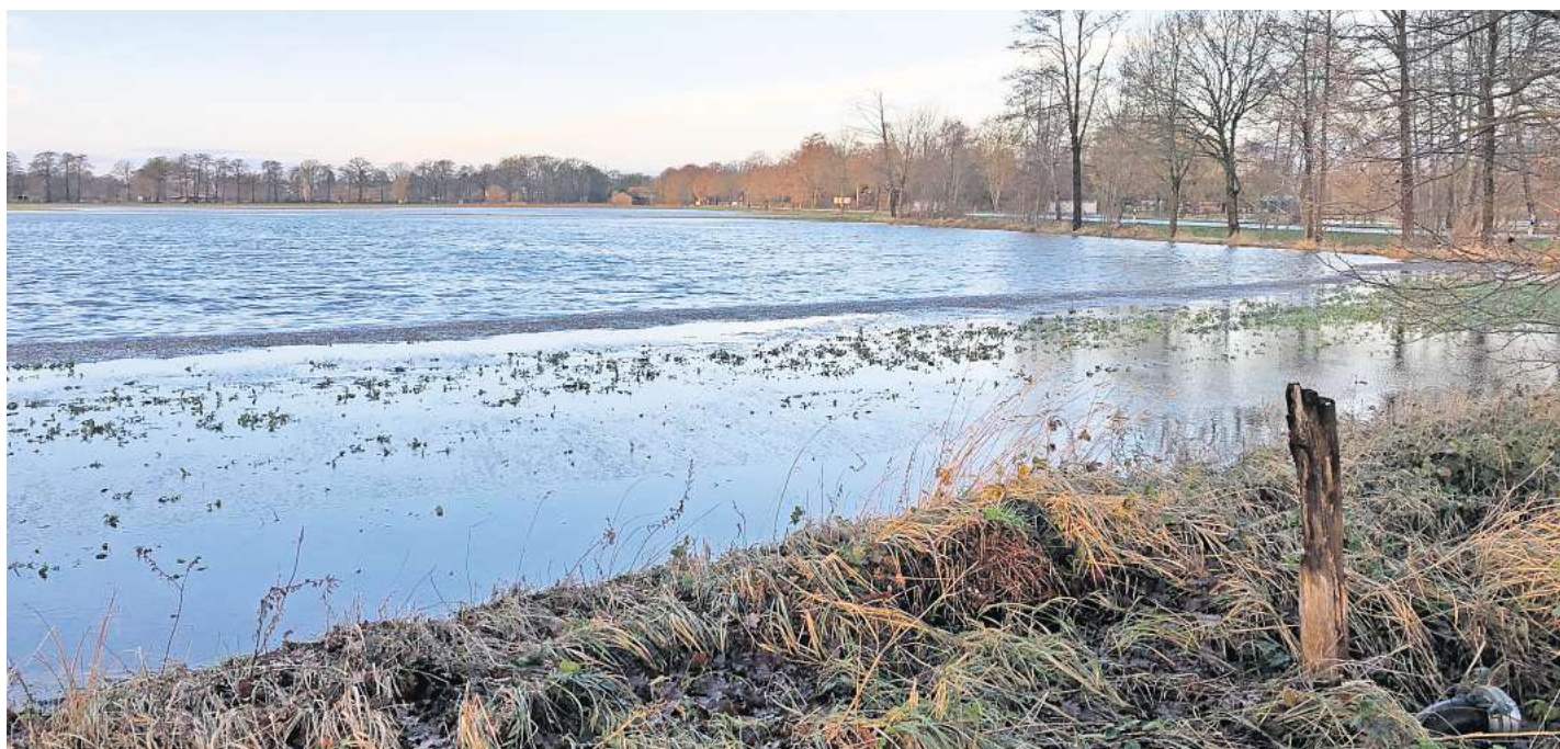
Überflutet: Auch die Felder vor der Autobahnbrücke zwischen Bissendorf und Bissendorf-Wietze stehen unter Wasser.

Lions Club unterstützt „Wedemärker für Wedemärker“ mit 5000 Euro für Hochwasseropfer