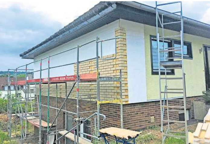
Eine Außendämmung mit Verklinkerung.