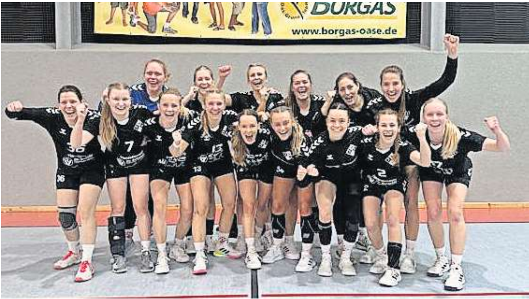
Bejubeln eine Glanzleistung: Die Damen des Mellendorfer TV.

In der Anfangsphase des Spiels wurde schnell klar, wie die junge Mellendorfer Mannschaft das Spiel für sich entscheiden will. Großenheidorn hatte viele Spielerinnen in ihren Reihen, die groß und robust waren. Mit dieser körperlichen Unterlegenheit hatten